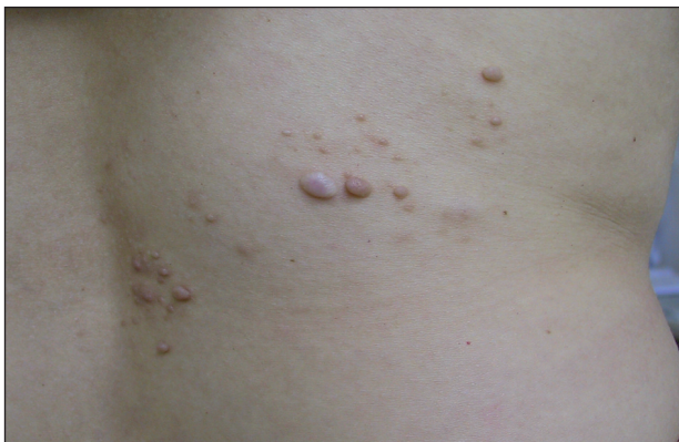
Obr. 1. Segmentální neurofibromatóza, bederní krajina.

Třicetiletá žena se dostavila na I. dermatovenerologickou kliniku FN U sv. Anny v Brně k vyšetření projevů v pravé bederní krajině. Před pěti lety si nechala odstranit v této lokalizaci hnědou papulu, která byla histologicky vyšetřena s nálezem verukózního névu, pravděpodobně se již tehdy jednalo o neurofibrom. V průběhu několika let se v okolí jizvy objevilo několik měkkých světle hnědých papul, v původní jizvě byla palpovatelná anetodermie (obr 1.)