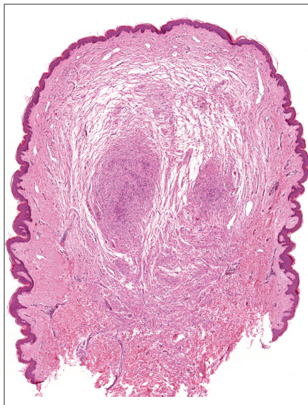
Obr. 2. Neurofibrom, hematoxylin-eozin, původní zvětšení 20x.

Klinický nález odpovídal segmentální neurofibromatóze, proto bylo doplněno komplexní kožní, neurologické, otorinolaryngologické a oční vyšetření, které neprokázalo patologické změny. Větší neurofibromy byly odstraněny excizí s hojením atrofickou jizvou. Vzhledem k absenci obtíží pacientka nebyla dále vyšetřována. V rodině paci-