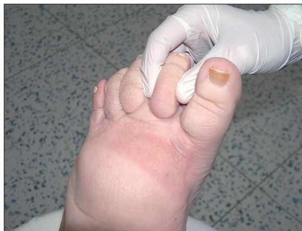
Obr. 5. Stemmerovo znamení (na druhém prstu nohy nelze vytvořit kožní řasu).

Lymfedém je otok, zpočátku chladný, měkký, mělký, blede barvy, nebolestivý; při palpaci v kůži lze vytlačit plastický, rychle mizející důlek. Postupem času otok tuhne, dochází k deformitě končetiny, která mění tvar, může dojít i ke vzniku elefantiázy. Zvláštní klinickou známkou lymfedému je Stemmerovo znamení (na 2. prstu nohy nelze vytvořit kožní řasu) (obr. 5). O lymfedému také svědčí nálezy zvláštního tvaru prstů, tzv. kvadrátních prstů , které vznikají působením tlaku okolí na měkké tkáni prstu, dále bradavičnaté kožní projevy – verruccosis lymphostatica , dále hyperkeratóza , zanořování vlasových folikulů do hloubky (kůže připomíná vzhled pomerančové kůry), atrofie až zánik nehtových plotének , xeróza , nálezy kožních puchýřků vyplněných lymfou ( chyloderma ), jejichž prasknutí je provázeno lymforeou . Tyto změny se mohou vytvořit i na genitálu při primárním lymfedému. Během dlouhodobého postižení může dojít ke vzniku vředu – ulcus lymphaticum . Lymfedém nejčastěji postihuje končetiny, ale může se manifestovat i v oblasti hlavy, krku, trupu nebo na genitálu. Otok bývá většinou