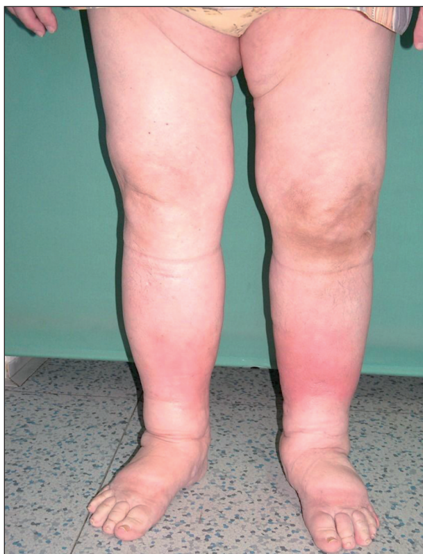
Obr. 2. Sekundární lymfedém (recidivující erysipely).

Sekundární lymfedém je častější. Příčina je známá. Utváří se na původně nepostíženém mizním systému v důsledku poškození mizních cest patologickým procesem nebo jejich útlakem. Poškozením vzniká překážka v oběhu lymfatického systému. Otok se vyvíjí během měsíce až několika roků (obr. 2, 3). Rozlišujeme benigní a maligní typ sekundárního lymfedému. Benigní typ je většinou postinfekční (viry, plísně, nejčastěji bakterie – erysipel, často recidivující), pooperační, postiradiační, posttraumatický, po popíchání hmyzem, arteficiální, parazitární (nejčastější příčina v rozvojových zemích). Maligní typ vzniká útlakem nebo invazí primárního nádoru nebo metastáz do mizního systému. Termínem kombinovaný