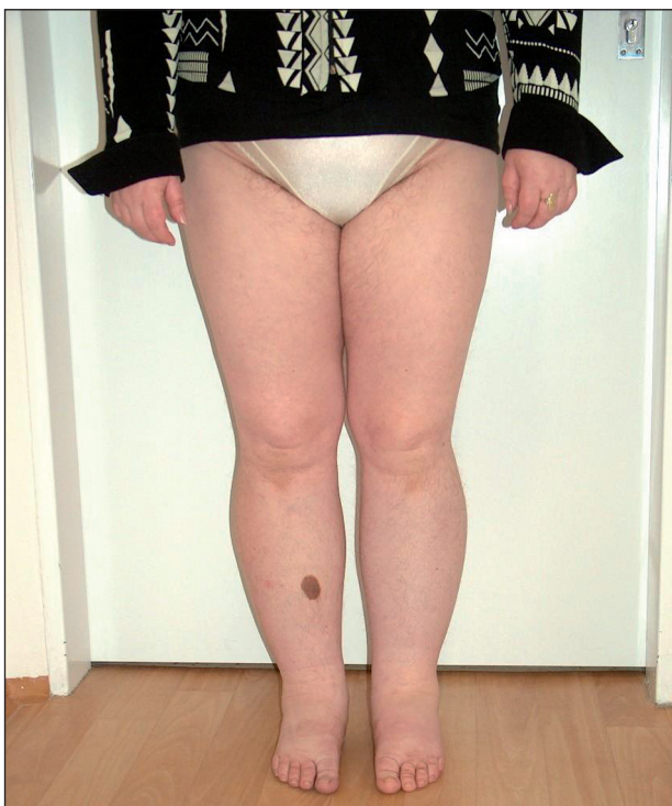
Obr. 1. Primární lymfedém dolních končetin (akcentace obtíží na levé dolní končetině).

Primární lymfedém je výsledkem primární poruchy v lymfatickém systému – ať už na podkladě hypoplazie či hyperplazie miznic. Záleží na stupni insuficience a na velikosti lymfatického břemene. V důsledku hromadění makromolekulárních bílkovin dochází k progredující fibrotizaci podkoží, a tak k nezvladatelnému stavu (1). Může být provokován infekcemi, traumaty, hormonálními změnami v dospívání, těhotenství a v menopauze. Jestliže se otok manifestuje brzy po narození do druhého roku života, nazývá se lymphoedema congenitum . Rozvoj otoku mezi druhým a třicátým pátým rokem života označujeme jako lymphoedema praecox , po třicátém pátém roce života jako lymphoedema tardum . Primární lymfedém může být i geneticky podmíněný (Nonneho–Milroyův syndrom – autosomálně dominantně dědičný lymfedém, nebo Meige syndrom – lymfedém podmíněný dědičným faktorem Mendlova typu, uplatňující se recesivně) (obr. 1).