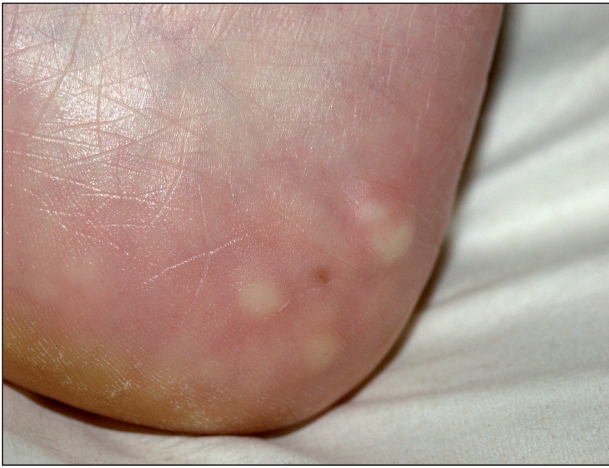
Obr. 2. Piezogení papuly na patě.