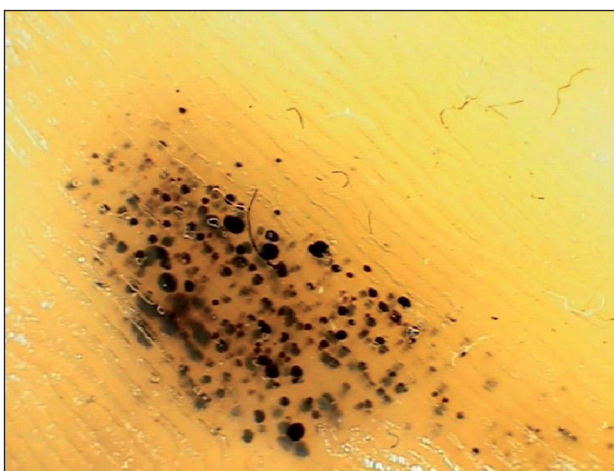
Obr. 5. Černé paty, dermatoskopický obraz.

Jde o častý nález především u mladších sportovců. Vzhledem k relativně tenké vrstvě podkožního tuku jsou kapiláry v dermálních papilách při hranici s epidermis vystaveny při intenzivním sportu značnému tlaku a střížným silám. To vede k jejich poranění a následně ke vzniku horizontálně uspořádaných, bodových, intraepidermálních a intrakorneálních hemoragií (3, 6, 10, 28, 29). Tyto léze jsou asymptomatické. Vyskytují se nejčastěji při horní hraně paty nad hranicí silnější plantární kůže, kde jsou podkožní kapiláry chráněny menší vrstvou tkáně (15, 18, 23, 28, 31). Postižení bývají například tenisté, fotbalisté nebo basketbalisté. Jediným úskalím tohoto benigního nálezu je možná záměna s maligním melanomem (3, 6, 10, 15, 18, 23, 28, 29, 31). V diferenciální diagnostice pomáhá anamnéza sportovních aktivit a často oboustranný nález. Dermatoskopický obraz je většinou jednoznačný (obr. 5). Diagnóza může být také potvrzena jemným odstraněním několika petechií skalpe-