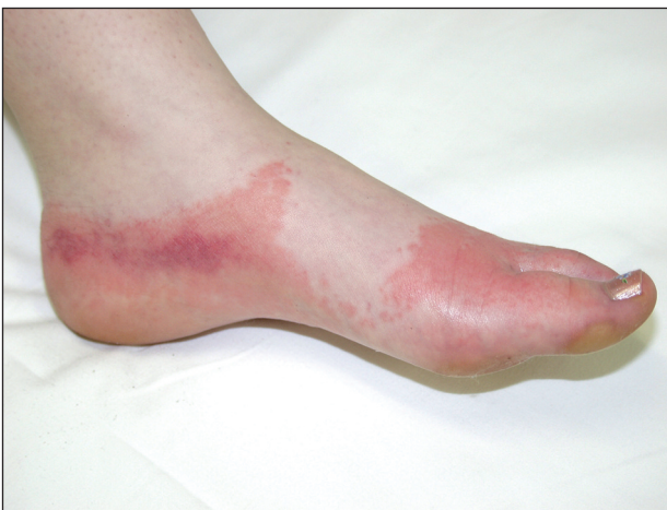
Obr. 10. Kontaktní ekzém na obuv.