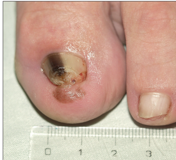
Obr. 4. Akrolentiginózní melanoma in situ , Hutchinsonovo znamení.

lunuly nacházíme v nehtovém lůžku (23). Následkem jsou hnědočervené až černé dyskolorace. Bývají oválné, ale mohou vznikat i třískovité hemoragie nebo lineární pruhy. V odborné literatuře je popsána řada obdobných stavů, pojmenovaných vždy podle příslušného sportu (angl. „ jogger's toenail, skier's toe, tennis toe, golfer's nails “ a další) (1, 3, 18, 23, 25, 28). Diferenciální diagnostika může působit obtíže především při podezření na akrolentiginózní variantu maligního melanomu. K upřesnění diagnózy slouží dermatoskopie či biopsie. K podezření na maligní melanom vede přesah dyskolorace do periunguální oblasti (Hutchinsonovo znamení) a nepravidelné zbarvení léze (15, 23) (obr. 4). Při akutním subunguálním hematomu připadá v úvahu drenáž, při déle trvající bolestivosti je nutné vyloučit postižení skeletu (23, 28). Hojení těchto nálezů je spontánní, ale je limitováno rychlostí růstu nehtové ploténky a může tak trvat 12 až 18 měsíců (10). Časem dochází k absorpci hematomu v lůžku a případná dyskolorace ploténky následně odrůstá spolu s nehtem (28). V prevenci se uplatňují vhodně přiléhající obuv a zastřížení nehtu mírně za laterální okraj prstu a spíše rovně. Nákup sportovní obuvi je doporučován spíše odpoledne a po sportu, kdy noha mírně sesedá (10).