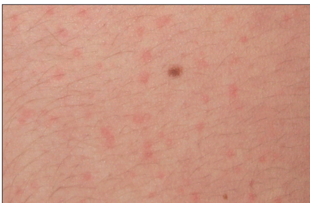
Obr. 12. Cholinergní kopřivka, detail.

a hrudník, ale může se šířit na končetiny i generalizovat (obr. 11, 12). Cholinergní kopřivka může být doprovázena celkovými příznaky, podobně jako jiné urtikárie. V léčbě se doporučuje profylaktické podání antihistaminik před expozicí vyvolávajícím faktorům (6, 23, 28). Prevencí je eliminace zjištěných příčin (28).