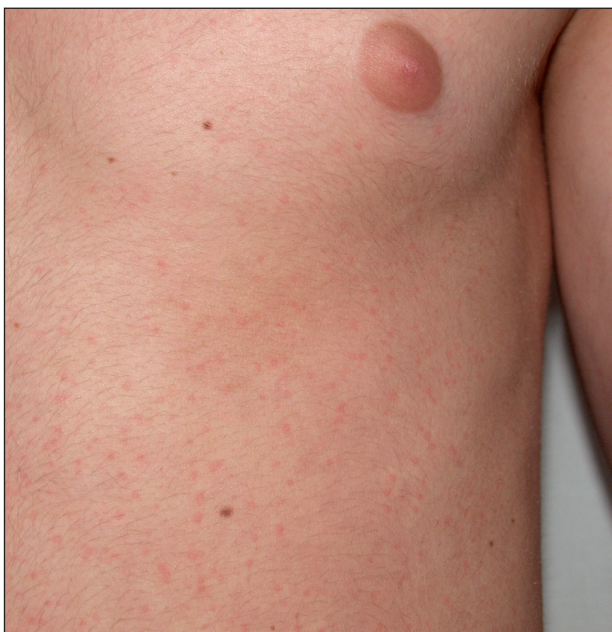
Obr. 11. Cholinergní kopřivka.