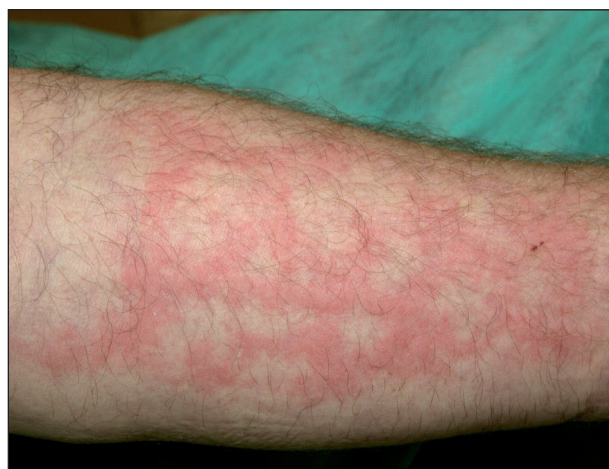
Obr. 13. Chladová kopřivka.

Solární kopřivka se objevuje několik minut po vystavení kůže slunci nebo umělým světelným zdrojům. Ustupuje většinou do hodiny po ukončení expozice (4, 24, 28, 30). Počátečním příznakem je svědění, následované erytémem a urtikariálním výsevem. Častěji než na opakovaně exponovaných oblastech (obličej, ruce) dochází k výsevu na místech méně často vystavených záření (trup). V léčbě první linie jsou doporučována antihistaminika, jako druhá linie pak desenzitizační fototerapie, případně PUVA (5). Pokud akční spektrum leží v UV oblasti, je prevencí účinná fotoprotekce, a to externí nebo