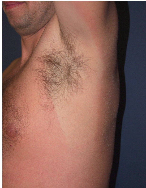
Obr. 8. Erythema solare.

Řada sportovců podceňuje účinnou fotoprotekci. Opakované spálení sluncem (obr. 8) podobně jako i kumulativní UV dávka zvyšují riziko melanocytových i nemelanocytových kožních nádorů. Riziku jsou vystaveni např. cyklisté, běžci, tenisté, veslaři a další. Expozice UV u lyžařů je zvýšena odrazem záření od sněhu a jeho celkově vyšším množstvím vzhledem k menší tloušťce atmosféry ve vyšších nadmořských výškách (18, 24, 25, 28). Zvýšená opatrnost je na místě v případech užívání léků s rizikem fototoxické reakce (tetracykliny, hydrochlorothiazid, amiodaron a další) (10, 24, 30).