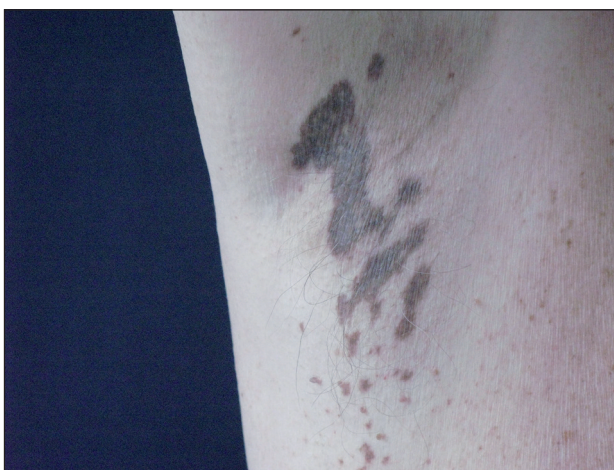
Obr. 2. Hnědočerné makuly v axile, detail.