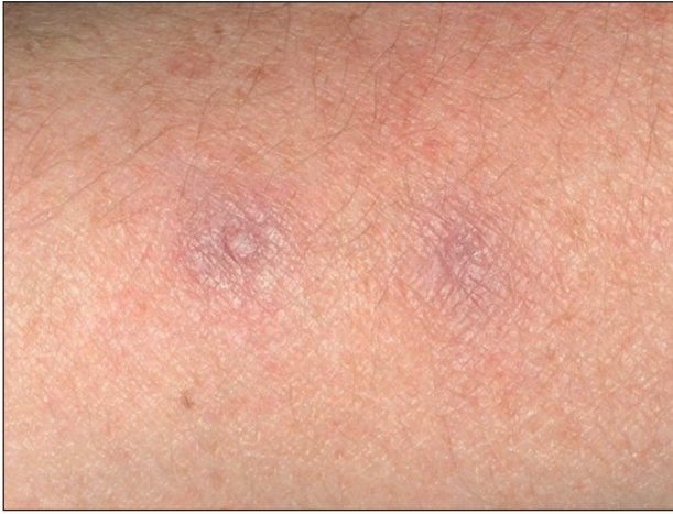
Obr. 6. Přetrvávající lividní erytémy po zhojení projevů na předloktí.

V histologickém nálezu byly patrné granulomy. Léčbu snášela pacientka velmi dobře, pravidelně byly prováděny oční kontroly a základní laboratorní vyšetření krve. Po odstranění posledního nodulu v 6/08 byla léčba ukončena.