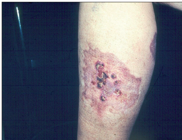
Obr. 7. Necrobiosis lipoidica exulcerans .

Ulcerace při amyloidóze vznikají rozpadem amyloidních uzlů na exponovaných místech.