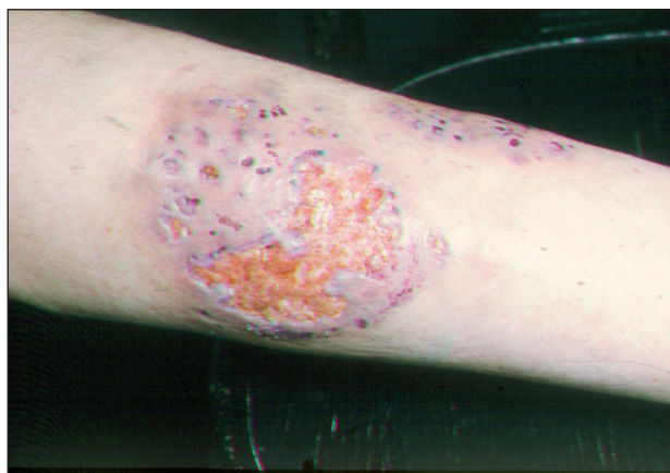
Obr. 9. Pyoderma gangraenosum.

Pyoderma gangraenosum začíná jedním nebo více zánětlivými ložisky černé barvy, s četnými pustulami nejčastěji na dolních končetinách. Tato ložiska splývají a tvoří plošně se rozšiřující ulcerace s nekrotickou spodinou a tmavočervenými podminovanými okraji (obr. 9).