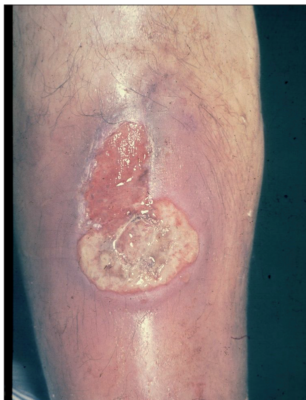
Obr. 1. Ulcus cruris posttraumaticum.

Ulcerace posttraumatické vznikají následkem komplikovaných zlomenin dolních končetin při sportech, dopravních nehodách nebo při náhodném poranění. Bývají obvykle spojeny s větší ztrátou tkání, s nekrózou tkáně poraněné nebo zhmožděné a jsou provázeny příznaky infekce vzniklé při kontaminaci (obr. 1).