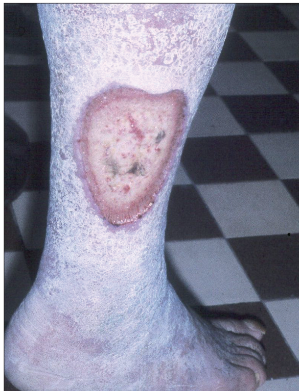
Obr. 6. Ulcus cruris hypertonicum .

Ulcus cruris hypertonicum (Martorell) je dalším typem bércového vředu cévního původu u osob s vysokým krevním tlakem. Příčinou tkáňového rozpadu jsou degenerativní změny cévní stěny a její zbytnění. Bývá obvykle lokalizován na zevní nebo přední straně bérce (obr. 6).