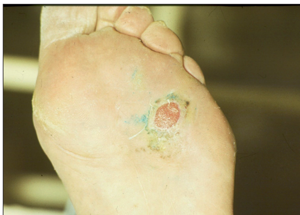
Obr. 8. Ulcus neuropathicum diabetorum .

Diabetická neuropatie je podmíněna periferní senzomotorickou polyneuropatií a autonomní senzomotorickou neuropatií. Kombinací těchto poruch vznikají nejčastěji nad hlavicí I. metatarzu nebolestivé ulcerace s hyperkeratotickým okrajem (obr. 8).