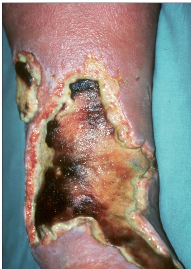
Obr. 2. Ulcus cruris post erysipelam.

K chemickým příčinám, které mohou výrazně poškodit kůži až vzniknou ulcerace, patří kyseliny, louhy, umělá hnojiva, rostlinné extrakty, dezinfekční prostředky a léky. V místě kontaktu s chemikálií nastupuje po předcházejícím zánětu nekróza, podle charakteru chemikálie kolikvační nebo koagulační. Kolikvační nekrózu způsobují koncentrované alkálie. Příškvary vzniklé jejich poleptáním jsou měkké, vzniklé ulcerace s neostře ohraničenými okraji. Naopak kyseliny způsobují koagulační nekrózu a vytvářejí příškvary tuhé, ostře ohraničené.