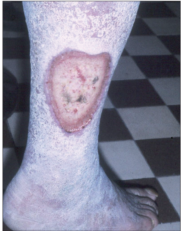
Obr. 6. Ulcus cruris hypertonicum .

Ulcus cruris hypertonicum (Martorell) je dalším typem bércového vředu cévního původu u osob s vysokým krevním tlakem. Příčinou tkáňového rozpadu jsou degenerativní změny cévní stěny a její zbytnění. Bývá obvykle lokalizován na zevní nebo přední straně bérce (obr. 6).