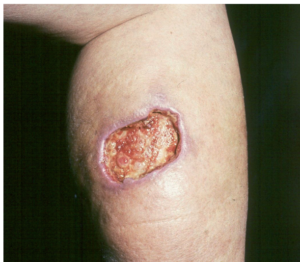
Obr. 3. Ulcus cruris arteficiále.

Arteficiální ulcerace se vyskytují na kterémkoliv místě těla, dolní končetiny nevyjímaje. Poškozující příčinou jsou látky chemické, které kůži poleptají, nebo účinky fyzikální, nejčastěji vysoké teploty (např. popálení cigaretou). Nápadným znakem takto navozených bérceových vředů je zdravé a nepostižené okolí (obr. 3).