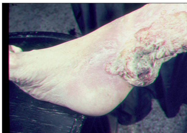
Obr. 10. Ca spinocelulare exulcerans.

Jednou z příčin bérčového vředu je rozpad tumoru. K nejčastějším nádorům, které vyúsťují v ulcerace patří: bazaliom, spinaliom, melanom, Kaposiho sarkom, angiosarkom, mycosis fungoides, metastázy vnitřních malignit do kůže. Na nádorovou příčinu onemocnění je třeba pomýšlet u nehojivých, na obvyklou léčbu nereagujících ulcerací (obr. 10).