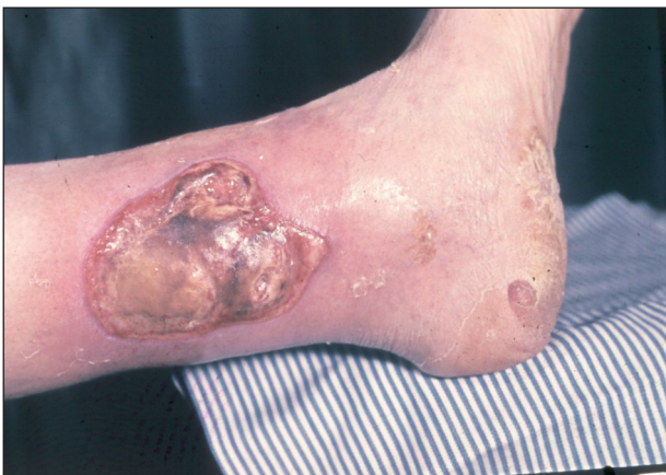
Obr. 5. Ulcus cruris arteriosum .

Trombangiitis obliterans Búrger je chronické zánětlivé onemocnění arteriálního a venózního systému dolních končetin, které vede ke gangrénám, nekrózám a ulceracím