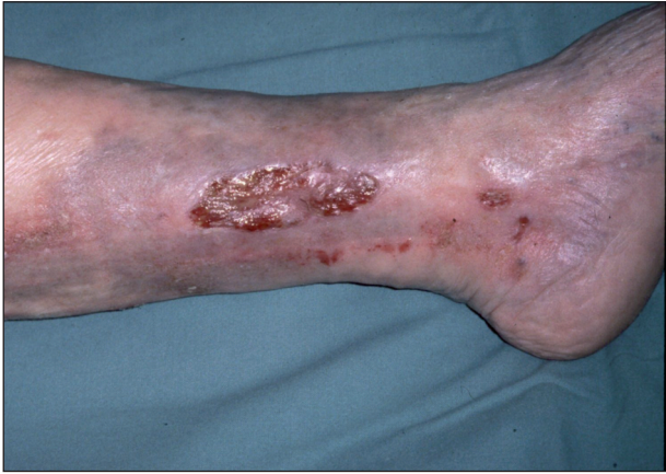
Obr. 4. Ulcus cruris venosum .

Bércové vředy posttrombotické bývají hluboké, rozsáhlé, často cirkulární s podminovanými okraji, s povleklou a výrazně exsudativní spodinou. Kožní změny v okolí jsou výraznější, zejména otok, který se záhy mění v tuhý – skleredém. Posttrombotické ulcerace se rovněž vyskytují ponejvíce v dolní třetině bérce, v oblasti, která se označuje jako „kamašovitá“ zóna.