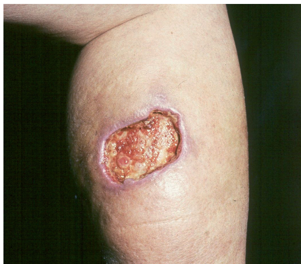
Obr. 3. Ulcus cruris arteficialis.

Arteficiální ulcerace se vyskytují na kterémkoliv místě těla, dolní končetiny nevyjímaje. Poškozující příčinou jsou látky chemické, které kůži poleptají, nebo účinky fyzikální, nejčastěji vysoké teploty (např. popálení cigaretou). Nápadným znakem takto navozených bérceových vředů je zdravé a nepostižené okolí (obr. 3).