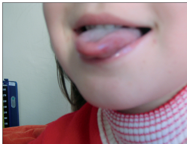
Obr. 9. Obr. 7, 8, 9: Hand, foot and mouth disease, 5-ročné dievča (enterovírusový exantém)

Atypická forma HFMD sa prejavuje tou istou klinickou symptomatológiou ako klasická HFMD, ale ulcerácie v ústnej dutine môžu absentovať. Na druhej strane možno pri atypickej HFMD pozorovať v ústnej dutine prejavy herpangíny s ulceráciami, no bez klinicky manifestnej dermatologickej symptomatológie ochorenia. V prípadoch s ťažkým priebehom až letálnym koncom sa za kritické obdobie pokladá 3.–4. deň trvania klinickej symptomatológie. Za prognosticky nepriaznivé sa považuje absentovanie ulcerácií ústnej dutiny, s výskytom makulopapulózneho alebo vezikulózneho exantému rúk a nôh, vracanie a zvýšená sedimentácia erytrocytov, niekedy aj leukocytóza a hyperglykémia. Vracanie je dôležitým príznakom upozorňujúcim na postihnutie centrálného nervového systému vo forme rozvíjajúcej sa intrakraniálnej hypertenzie v dôsledku encefalitídy zadného mozgu, osobitne ponsu. Veľmi závažná je aj symptomatológia kardiopulmonálneho zlyhania vznikajúca pri intersticiálnej pneumonitíde a myokarditíde.