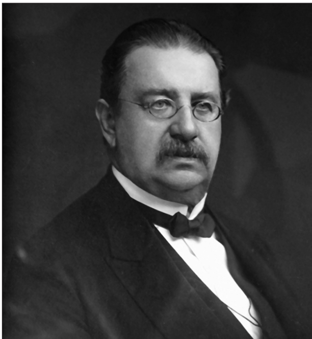
Obr. 1. Prof. Vítězslav Janovský.

nemocí a vedle toho suploval od roku 1874 na I. chirurgické klinice za profesora Blažinu. Byl tedy vytížen vedením více pracovišť a sotva se tak mohl věnovat vědecké práci. Existuje ale také domněnka, podle které Weiss vedl kožní oddělení s úmyslem, že je předá ve vhodné době některému schopnému českému lékaři, kterého nakonec viděl ve Vítězslavu Janovském.