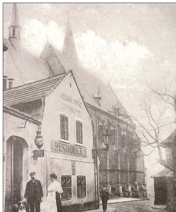
Obr. 2. Jedová chýše.

Janovský ovládal kromě češtiny a němčiny i angličtinu, francouzštinu a italštinu. Měl tak v dosahu zdroje poznání z celého kulturního světa, a ty užíval při svých výkladech studentům. V žádné klinické přednášce neslyšeli studenti citovat tolik světových lékařských autorit jako u Janovského. Nikdy se také neopomenul zmínit o „svém příteli Unnovi“. Nejlepším zrcadlem vylíčeného obrazu