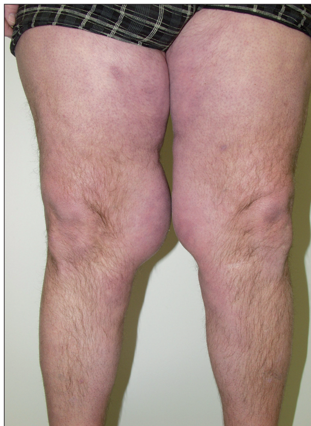
Obr. 2. Detail tukových depozit na stehnech.

Pacientkou byla 65letá žena, astmatička, hypertonička, s hypothyreózou, vředovou chorobou žaludku, po revmatické horečce v r. 1968 a cholecystektomii pro lithiázu v r. 1961. Dostavila se na naši kliniku pro 2 roky trvající symetrické zmnožení tukových valů na horních končetinách s maximem nad lokty. Pacientka byla nekuřačka, s negativní anamnézou abúzu alkoholu. Vyhledala nás pro progresi projevů v distálních partiích paží, kterou zaznamenala tím, že si nemohla obléci svoji oblíbenou halenku (obr. 3). Lipomatózu v rodině nikdo neměl. Z léků brala dlouhodobě molsidomin, hydrochlorothiazid, amilorid, levothyroxin a itoprid. V září 2003 prodělala i salmonelovou gastroenteritidu s difúzní hepatopatií. Rok