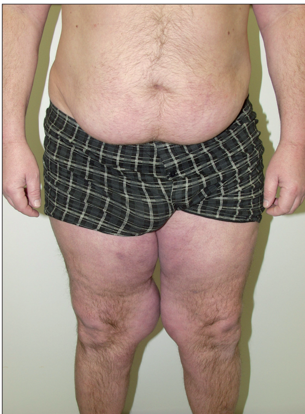
Obr. 1. BSL – gynekoidní typ.

0,93 g/l (0,8–0,9 g/l), snížení HDL 1,24 mmol/l (1,6–1,8 mmol/l). Kyselina močová byla při celkové léčbě antiuratiky jen nadhraniční, a to 481 \mu\text{mol/l} (140–340 \mu\text{mol/l} ). Ostatní laboratorní výsledky včetně hormonů štítné žlázy a markerů hepatitid byly v mezích referenčních hodnot. Při sonografickém vyšetření břišních orgánů byla zjištěna hepatomegalie při steatóze jater, bez ložiskových procesů. Pacient byl předán do péče metabolické poradny pro poruchy tuků a ve spolupráci s plastickým chirurgem provedeno liposukční ošetření. Po tomto ošetření došlo k výrazné redukci tukových mas v podkoží stehen a pacient se mohl vrátit do běžného života bez omezení pohybu. Vzhledem k nedávno provedenému liposukčnímu výkonu jsme zatím nepozorovali progresi onemocnění.