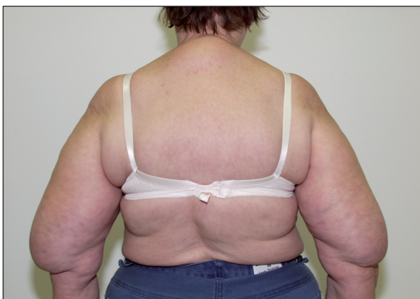
Obr. 4. BSL – pseudoatletický typ v kombinaci s Madelungovým krkem.

3,51 mmol/l (3,0–3,4 mmol/l) a snížení HDL 1,19 mmol/l (1,6–1,8 mmol/l). Kyselina močová a další laboratorní výsledky včetně markerů hepatitid a hormonů štítné žlázy byly v mezích referenčních hodnot. Sonografické vyšetření projevů na pažích prokázalo nápadně bohatou tukovou tkáň bez edému a bez omezení cévních a nervových svazků. Na USG jater byla zjištěna vyšší echogenita při difuzní hepatopatii v rámci výraznější steatózy, bez ložiskových změn v parenchymu. Lipomatóza byla zjištěna i v retroperitoneu.