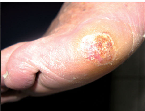
Obr. 1. Akrolentiginózní melanom, laterální strana levé nohy.

Poté byl pacient předán do naší péče k dispenzarizaci. Byla provedena screeningová vyšetření. Rentgenové vyšetření plic prokázalo postspecifické změny v horním plicním poli a v popisu ultrasonografie břicha byla difúzní jaterní léze bez hepatomegalie. Krevní testy byly v mezích normy.