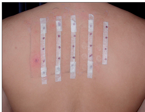
Obr. 4. Pozitivní epikutánní test na PPD a benzokain u pacienta č. 1.

vyšetřena v květnu 2004. Na počátku května si nechala na dovolené v zahraničí provést na bérce tetováž henou. Sedmý den se objevily v místě tetováže vezikuly na výrazně zánětlivém a edematózním podkladě (obr. 5, 6). Lokální nálezy se stále zhoršoval a byl provázen silným pruritem. Byla léčena 12 dní za hospitalizace lokálními kortikosteroidy s elastickou bandáží, ale i kortikosteroidy celkovými v dávce 200 mg hydrokortisonu denně po dobu 4 dní a antihistaminiky. Byla propuštěna zhojena. V únoru 2005 byly provedeny epikutánní testy rutinní sadou Trolab Hermal a byla prokázána kontaktní přecitlivělost na PPD na +++ (obr. 7). Testy byly odečítány po 24–48 a 72 hodinách. Primární senzibilizace vznikla nejspíše po barvení vlasů tmavou barvou v minulosti, aniž došlo ke vzniku kontaktního ekzému.