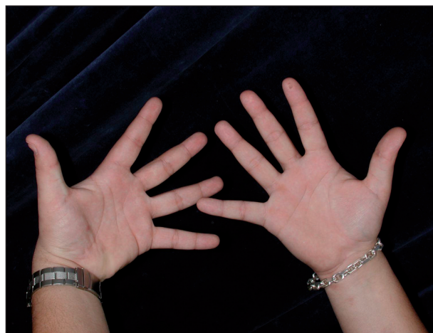
Obr. 3. Kontaktní ekzém na rukách u pacienta č. 1.