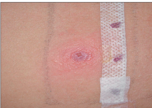
Obr. 7. Pozitivní epikutánní test na PPD u pacienta č. 2.

a 96 hodinách. Tím, že epikutánní testy na čistou henu byly negativní, byla zpětně potvrzena přítomnost PPD v heně, kterou bylo prováděno kreslení na kůži u obou pacientů.