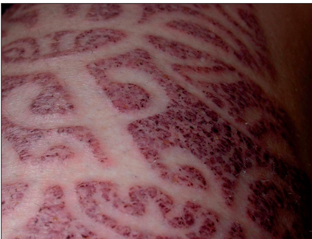
Obr. 6. Detail kontaktního ekzému na bérce u pacienta č. 2.