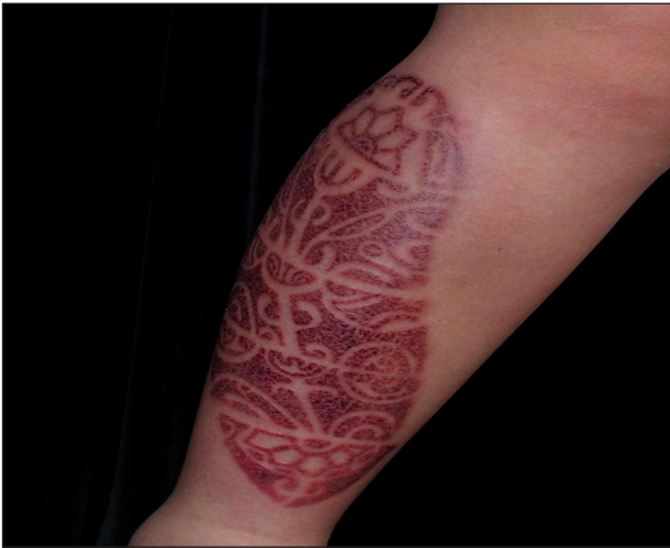
Obr. 5. Kontaktní ekzém na bérce u pacienta č. 2.