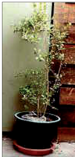
Obr. 1. Hena - lat. Lawsonia Inermis .

Hena, latinsky Lawsonia inermis , je keřík s malými, zelenými, vonnými lístky, z jehož květů se vyrábějí vůně a parfémy, listy a kůra rostlin se zpracovává na prášek k barvení vlasů a malování kůže (obr. 1). Květy jsou bílé až červené barvy, vydávají silnou sladkou vůni považovanou za afrodisiakum. Dorůstá délky průměrně 2–3 metrů, ale i více, a pro své barvicí účinky na kůži je známa a pěstována více než 5000 let. Roku 1890 se dostala do Evropy, kde byla používána nejen k barvení vlasů, ale i při léčbě různých kožních chorob. Roste na nejrůznějších místech světa, např. v arabských zemích, Egyptě, Tunisu, Indii, Pákistánu, Maroku, Austrálii a jinde. Přírodní barvivo heny se využívá tisíce let nejen k péči o vlasy, ale i jako prostředek ke zkrášlení těla, malování rtů i nehtů. Hena keře Lawsonia inermis je červená, Lawsonia alba je bílá varianta, Lawsonia spinosa je varianta černá. Přírodní barvicí vlastnosti jsou dány obsahem taninů. Prášek z heny je zelený. Sušené listy heny se smíchávají s vodou na pastu, která se