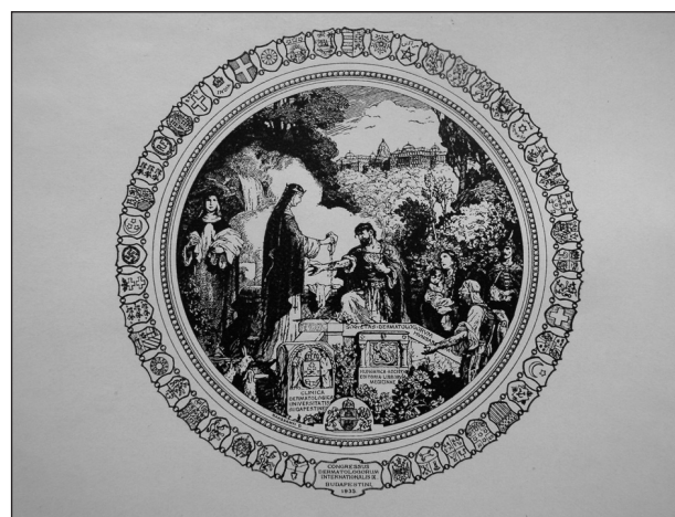
Obr. 3. Emblém IX. medzinárodného dermatologického kongresu v Budapešti (1935, uvedený v CIMC).