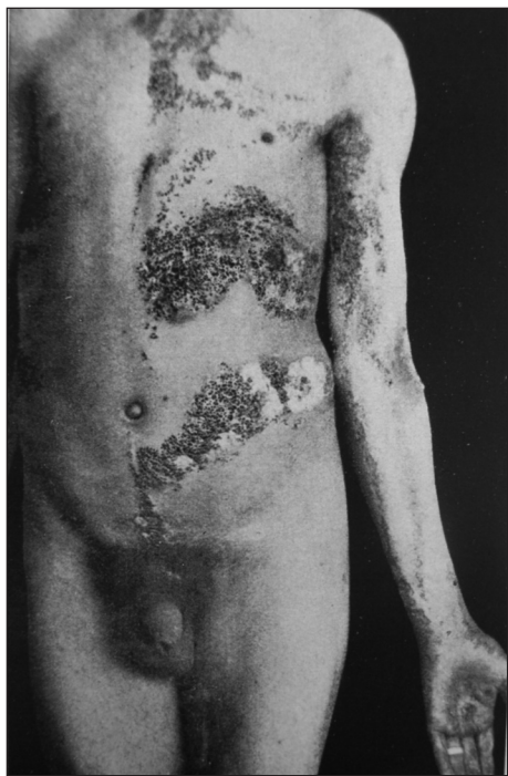
Obr. 4. Naevus comedoniformis et hyperkeratoticus unilateralis segmentarius (od profesora Trýba, Brno).

V prvom zväzku po úvodnom slove nasledujú prehľady skratiek a znakov, a to lekárskeho termínov, názvy liekov, niektorých dôležitých bunkových typov, významných reakcií (napr. Mantoux, Bordet-Wasser-