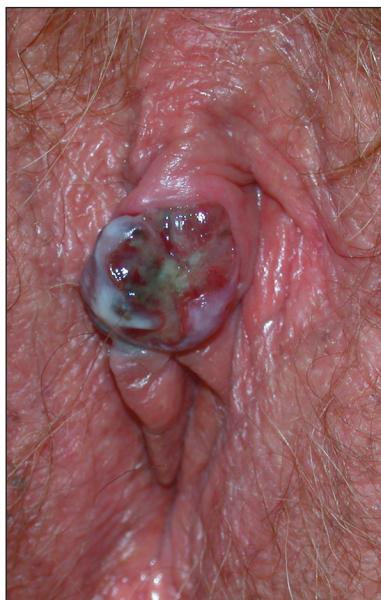
Obr. 1. Exulcerovaný melanom klitorisu.

V pooperačním období se objevil lymfedém pravé dolní končetiny, který v mírné formě i přes léčbu přetrvává. Ingvinnální a vulvární incize jsou po 9 měsících dobře zhojeny (obr. 3) a pacientka je bez známek recidivy.