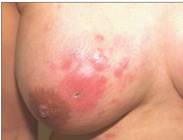
Obr. 1 a 2. Mnohočetné, tuhé, červené, silně bolestivé noduly na prsech.