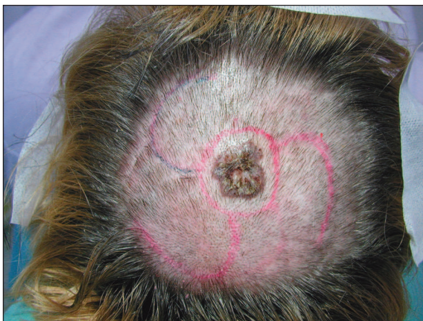
Obr. 1. Předoperační schéma.

Operační výkon byl proveden v místním umrtvení (Supracain® 12 ml). Všechny incize byly vedeny podle na kůži zakresleného schématu (obr. 1). Nádor byl excidován s bezpečnostním lem 0,5 až 1 cm. Kruhovitá rána měla průměr 4 cm. Na spodině zasahovala až do galea aponeurotica. Po přípravě křídel laloku a důkladném podminování celého operačního pole byla rána uzavřena