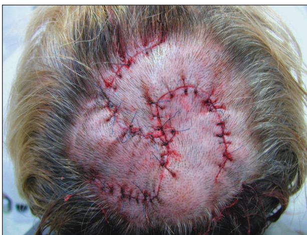
Obr. 2. Sutura bezprostředně po zákroku.

pomocí laloku větrného mlýna se třemi křídly. K sutuře jednotlivými stehy bylo použito monofilní vlákno pevnosti 4–0 (obr. 2). Krytí rány bylo provedeno pomocí solutio Novikov.