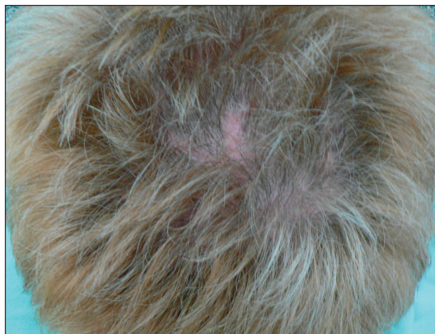
Obr. 3. Stav po 4 měsících.

Histologické vyšetření potvrdilo diagnózu bazaliomu s pigmentem. Při kontrole 3 měsíce po výkonu byly výsledné jizvy nenápadné s dobrým růstem vlasů v opeřované oblasti (obr. 3).