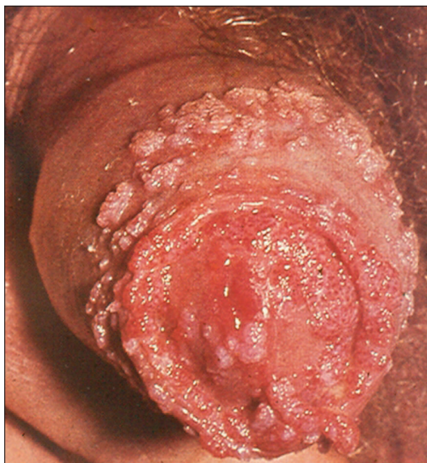
Obr. 6. Condylomata accuminata.

V klinickém obrazu nalézáme zpočátku menší, více či méně pigmentované papulky velikosti špendlíkové hlavičky postupně splývající ve větší ložiska malinovitého vzhledu (viz obr. 6).