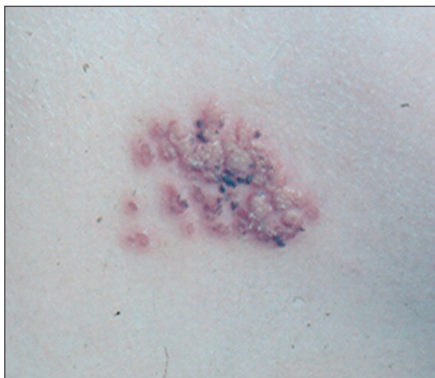
Obr. 1. Herpes simplex.

HSV-1 a HSV-2 jsou řazeny k tzv. humánním herpesvirům (tab. 1). Tato skupina virů se vyznačuje sklonem k přechodům do latentních stadií. Skupina se dělí do 3 celků: \alpha , \beta a \gamma herpes viridae. HSV-1 a HSV-2 patří k \alpha herpetickým virům (viz tab. 1 podle G. Grosse, 9). Po primární infekci sliznic a kůže přežívají viry v příslušných senzorytických gangliích v neinfekčním, latentním stavu. V tomto stavu nejsou v neuronech prokazatelné (molekulárně biologickými technikami) virové strukturální proteiny, pouze genom HSV a regulační proteiny spojené s fází latence. Replikace viru je snad řízena buněčným imunitním dozorem. Ovlivnění těchto kontrolních mechanismů vede k aktivaci herpetické infekce na kůži. Replikace DNA u HSV v centrálním nervovém systému