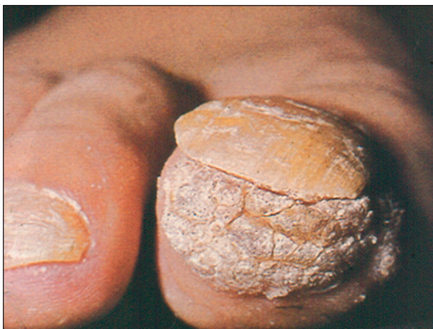
Obr. 5. Verruca vulgaris (subungválně a periungválně).

Jde o lokalizační variantu bradavic v oblasti nehtového valu (obr. 5). Terapie bývá bolestivá.