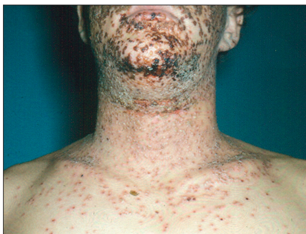
Obr. 3. Eczema herpeticatum.

Eczema herpeticatum je charakterizováno jako rozvíjející se infekce HSV na podkladě endogenního ekzému, či na podkladě jiných zánětlivých dermatóz (např. u ichtyózy, Darierovy choroby, T-buněčných kožních lymfomů, Sézaryho syndromu apod., obr. 2). Onemocnění se objevuje jako manifestace primárního či recidivujícího charakteru s výsevem herpetických puchýřků – charakte-