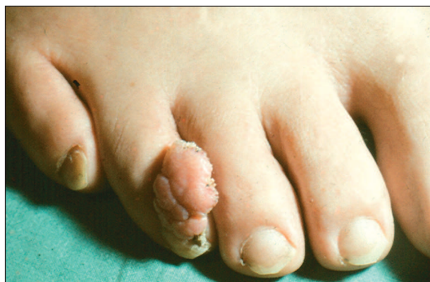
Obr. 4. Verruca vulgaris .

Diagnóza je možná většinou již pohledem. U atypických variant je nutno pomýšlet na řadu diferenciálních