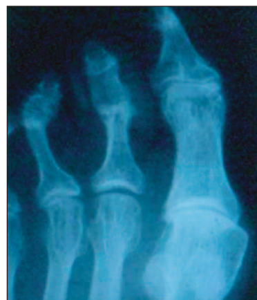
Obr. 4. Akroosteolýza distálních falang palců nohou.

1. Destrukce artikulární kosti. Specifickou formou kostní destrukce je destrukce terminálních falang prstů, tzv. akroosteolýza (obr. 4).