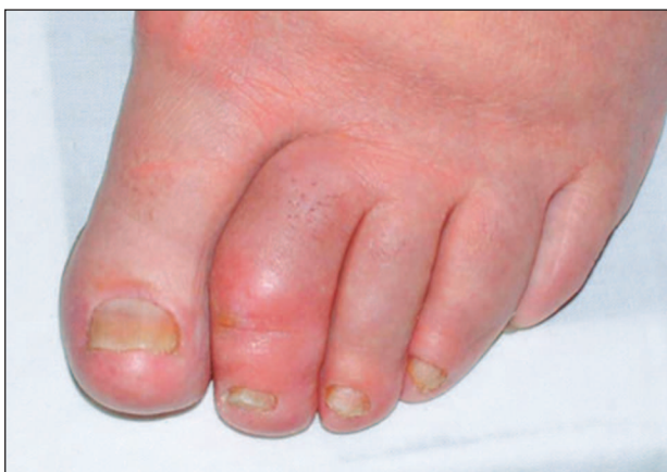
Obr. 3. Daktylitida II. prstu nohy.

skupina pacientů, zhruba 5 až 15 %, u které se kloubní syndrom manifestuje před kožním syndromem (10). Existují však určité charakteristické klinické a radiologické zvláštnosti, které dovolují pomýšlet na diagnózu psoriatické artritidy ještě před manifestací kožního syndromu (tab. 1 a 2).