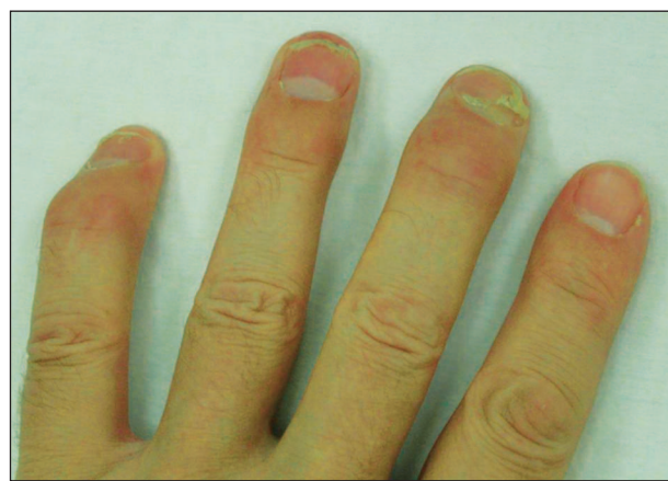
Obr. 1. Preferenční postižení DIP kloubů psoriatickou artritidou. Na DIP kloubech jsou nodózní deformity, mírný otok, na nehtech diskretní známky psoriázy.

Převažující postižení DIP kloubů: V literatuře se uvádí kolem 15 %. Ve skutečnosti je ale izolované, resp. převažující postižení DIP málo časté. Tato forma je zpravidla asociována s psoriatickým postižením nehtů (obr. 1).