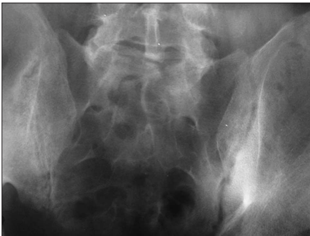
Obr. 6. Oboustranná sakroiliitida s rozšířením kloubní štěrbin, erozemi a sklerózou.

Postižení SI kloubů ve smyslu sakroiliitidy je charakterizováno erozemi, sklerózou, změnami šíře kloubní