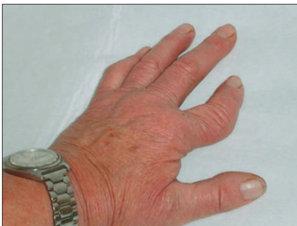
Obr. 2. Mutilující deformita (klinický korelát „opera glass“, digitus telescopicus). Téměř úplná resorpce středního článku II. prstu ruky, resorpce báze distální falangy stejného prstu.