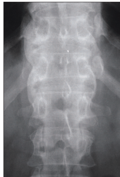
Obr. 7. Syndesmofyty na předním okraji těla obratlů C4-C5, C5-C6. Parasyndesmofyty v oblasti Th/L přechodu.