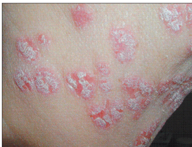
Obr. 2. Šupící ložiska před zahájením léčby terbinafinem.