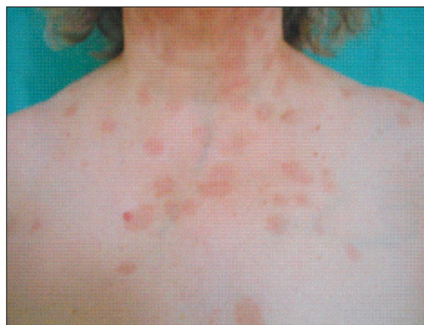
Obr. 4. Výsledné hyperpigmentace po léčbě.