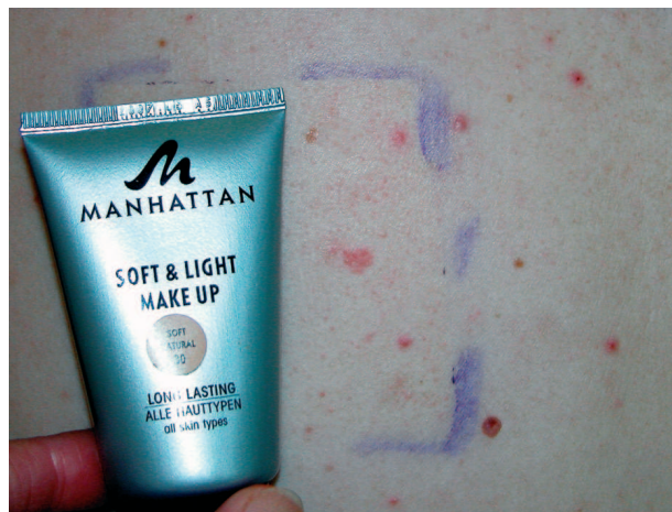
Obr. 4. Epikutánní test s kosmetikou – kontaktní alergie v testu.