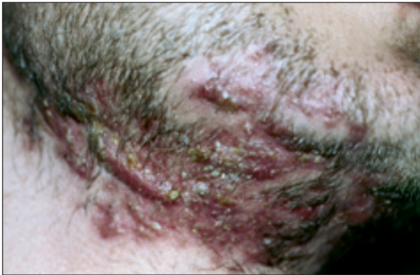
Obr. 2. Tinea barbae – projevy lokalizované mandibulárně a na krku.

Osobní anamnéza: bezvýznamná, nikdy nebyl vážněji nemocen.