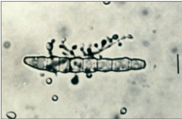
Obr. 5. Trichophyton mentagrophytes – makrokonidie, nativní preparát, interferenční fázový kontrast (úsečka 10 µm).

sů. Buněčnou součástí zánětlivé reakce byly také lymfocyty, plazmocyt, ojedinělé eozinofily a místy jednotlivé či v drobných skupinkách obrovské mnohjaderné buňky. Zánět prostupoval celou tloušťkou zastiženého koria.