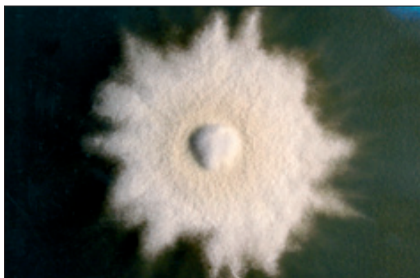
Obr. 3. Kolonie Trichophyton mentagrophytes .

vaci. Bakteriologická kultivace prokázala po 2 dnech koaguláza-negativní stafylokoky a Propionibacterium acnes , mykobakteria izolována nebyla, také vyšetření na aktinomykózu bylo negativní. Po 5 dnech se na Sabouraudově agaru s cykloheximidem při teplotě 27 °C objevily drobné plísňové kolonie, po 9 dnech byl jejich růst zřetelný. Makroskopicky byly bílé se žlutým nádechem, hrubě zrnité, jejich střed byl mírně vyzdvižený a okraje zrnité s paprscitě se rozbíhajícími jemnými vlákny (obr. 3). Pro bližší identifikaci byla použita mikrokultura – v mikroskopickém obrazu byly na septovaných vlákních kulovité mikrokonidie a chlamydospory, nechyběla ani vlákna vzhledu úponků vinné révy, která jsou typická pro T. mentagrophytes . Z kultury byl dále zhotoven nativní preparát s Lugolovým roztokem, v němž byly prokázány makrokonidie kyjovitého tvaru s příčnými septy (obr. 4, 5). Identifikace byla doplněna biochemickým ureázovým testem, který prokázal T. mentagrophytes var. mentagrophytes .