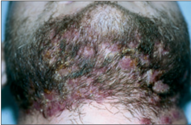
Obr. 1. Tinea barbae – klinický obraz.

Status localis: Při přijetí byl na pravé straně krku submandibulárně prknořitý infiltrát, ze kterého vytékal řidký žlutý hnis. Na tvářích v místě vousů, submandibulárně a na přední straně krku se vyskytovaly splývající měkké noduly živě červené barvy, na povrchu s pustulami a nánosy medově žlutých krust (obr. 1, 2). Po zatlačení vytékal z četných píštělí hnis, vousy byly uvolněné a spontánně vypadávaly. Všechny projevy byly výrazně zánětlivé se zvětšením regionálních lymfatických uzlin.