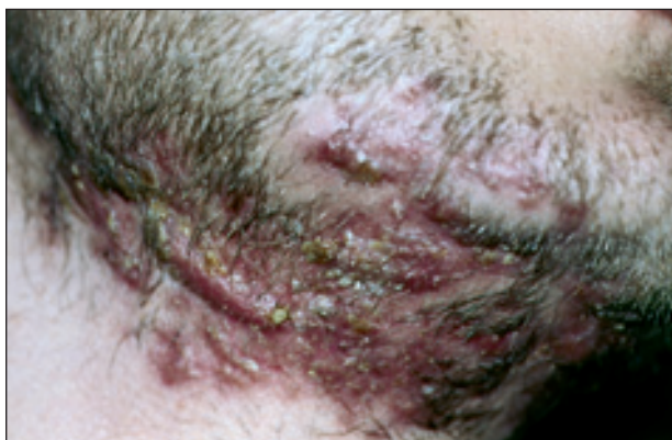
Obr. 2. Tinea barbae – projevy lokalizované mandibulárně a na krku.

Osobní anamnéza: bezvýznamná, nikdy nebyl vážněji nemocen.