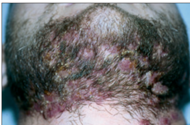
Obr. 1. Tinea barbae – klinický obraz.

Status localis: Při přijetí byl na pravé straně krku submandibulárně prknořitý infiltrát, ze kterého vytékal řídce žlutý hnis. Na tvářích v místě vousů, submandibulárně a na přední straně krku se vyskytovaly splývající měkké noduly živě červené barvy, na povrchu s pustulami a nánosy medově žlutých krust (obr. 1, 2). Po zatlačení vytékal z četných píštělí hnis, vousy byly uvolněné a spontánně vypadávaly. Všechny projevy byly výrazně zánětlivé se zvětšením regionálních lymfatických uzlin.