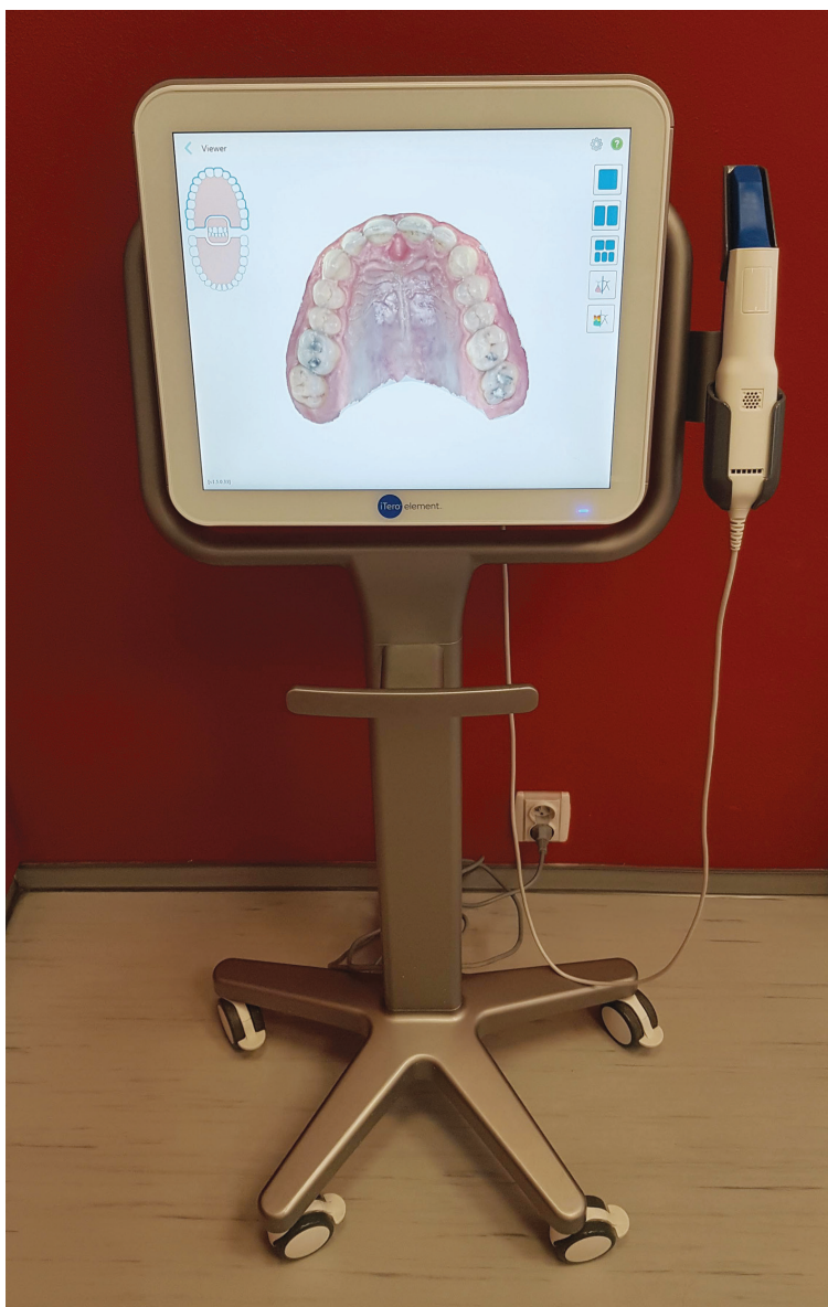
Fig. 1 Intraoral scanner iTero Elements.