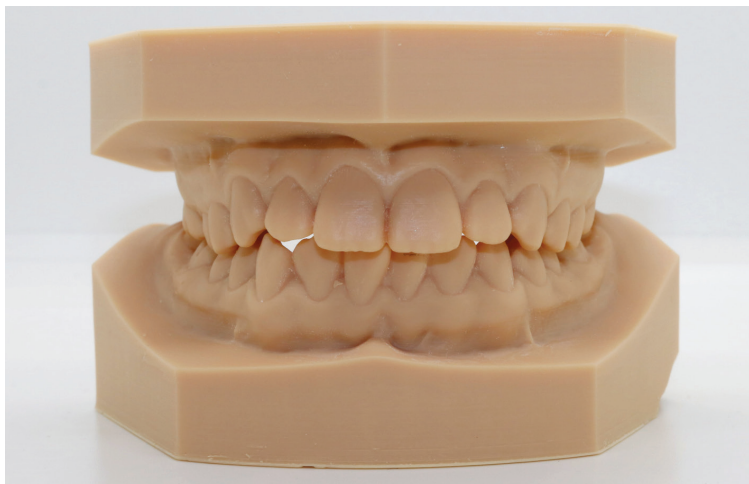
Obr. 2 3D tištěné modely chrupu.