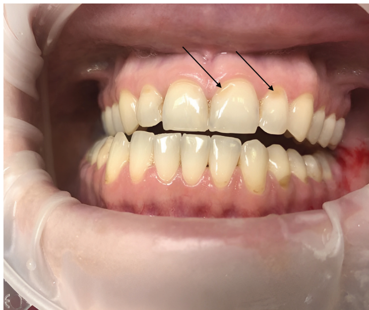
Obr. 3 Zubní eroze – lokalizace erozivních lézí závisí na zdroji kyselin vyvolávajících dané defekty (označené černou šipkou)

Fig. 3 Dental erosion – the location of erosive lesions depends on the sources of acids causing the defects (black arrow)