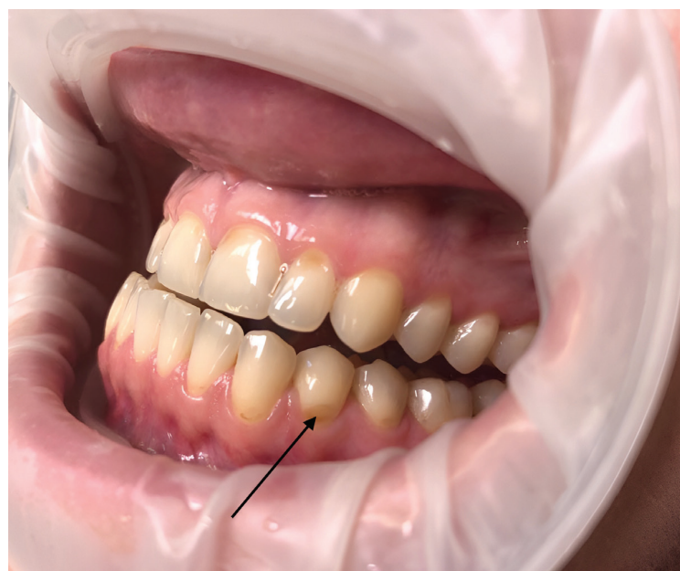
Fig. 4 Dental erosion (black arrow)