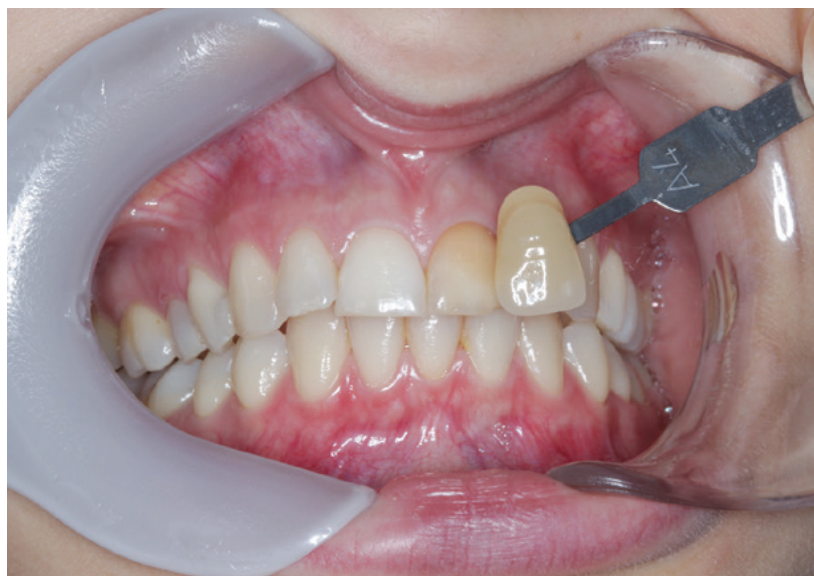
Fig. 1 Tooth discolored by zinc-oxide eugenol based sealer