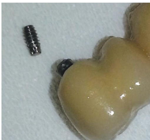
Obr. 2 Vybařený prasklý fixační šroubek spolu se suprakonstrukcí

Fig. 1 A complication of an unsolved loose screw in the abutment. Screw fracture – a view into the fixture