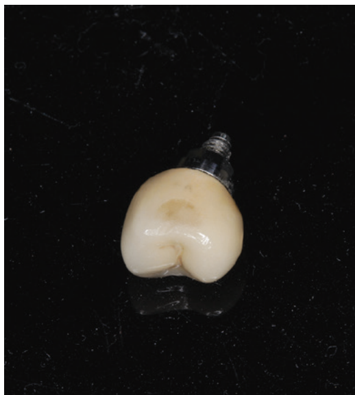
Obr. 4 Uvolněná korunka cementovaná na abutment definitivním fixačním cementem