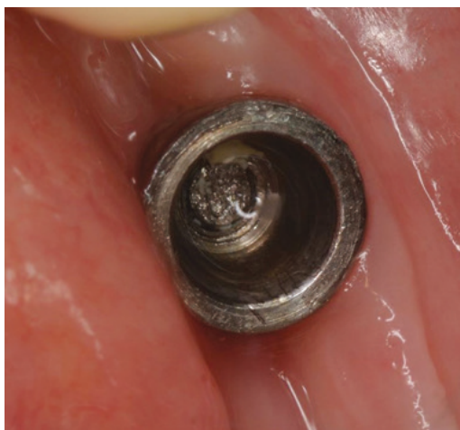
Obr. 1 Komplikace včas neřešeného uvolněného šroubku v abutmentu. Fraktura šroubku – pohled do fixtury

Pro efektivní prevenci uvolnění šroubku v abutmentu jsou používány širší fixtury,