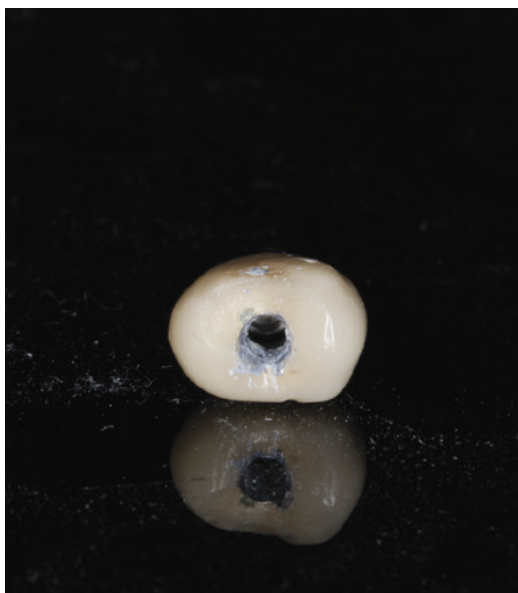
Obr. 5 Nalezení fixačního šroubku. Korunka je převedena z cementované na podmíněně snímatelnou