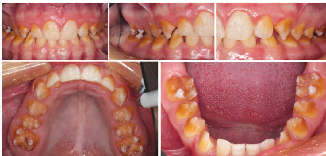
Obr. 1 Výchozí stav