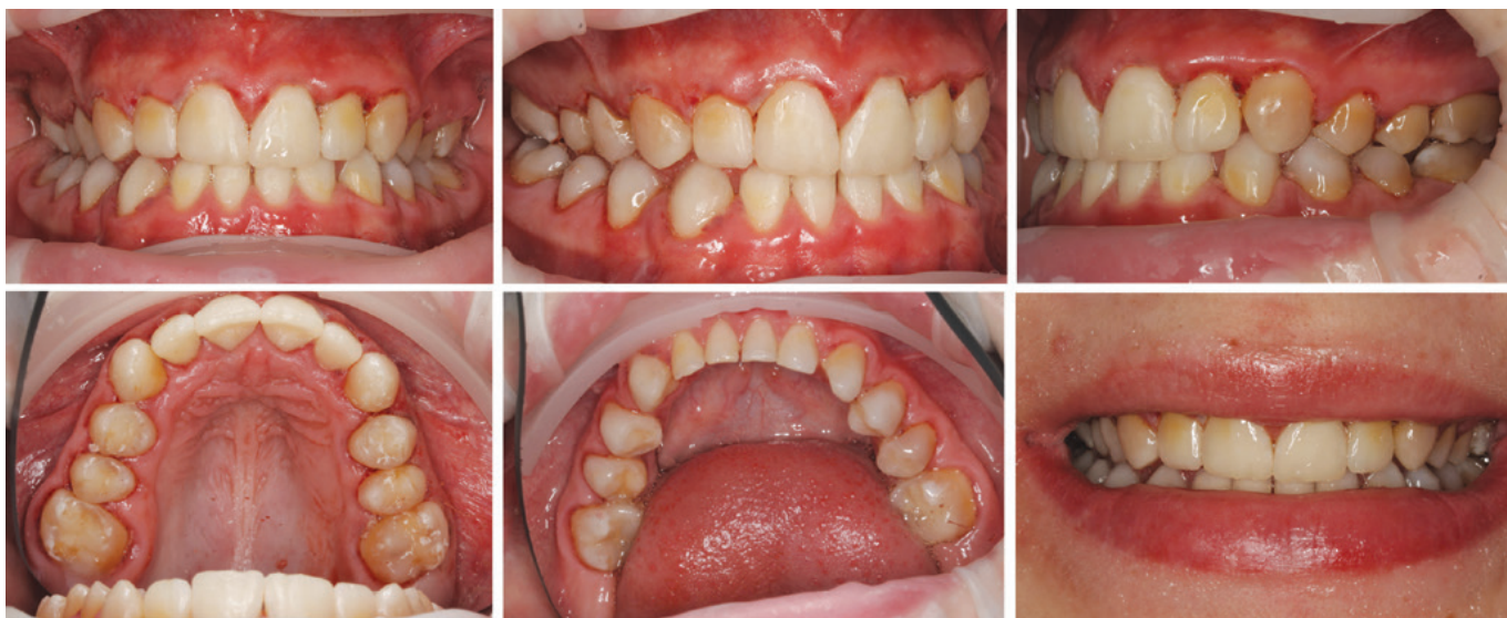
Obr. 4 Stav po dokončení přímé rekonstrukce