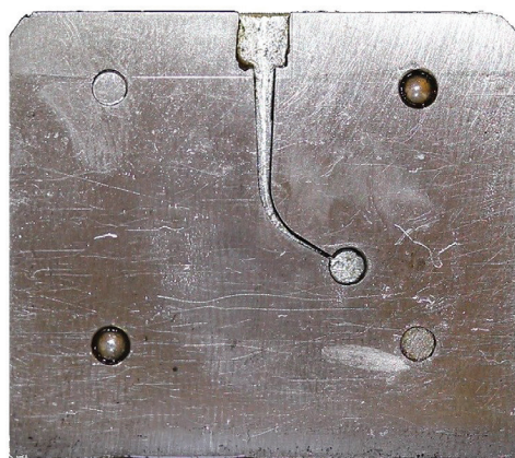
Obr. 2 Maketa kořenového kanálku, nerezový bloček

Výsledky byly vzájemně porovnávány ze čtyř skupin měření. Oba typy nástrojů byly porovnány při teplotách 20\text{ °C} a 35\text{ °C} a dále byly porovnávány u obou typů nástrojů výsledky získané pro jednotlivé teploty. Výsledky jsou shrnuty v tabulce 1 .