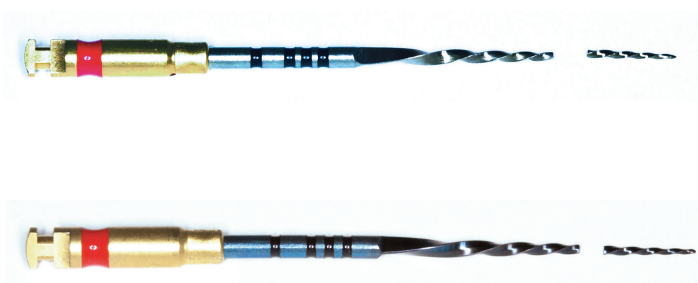
Obr. 3 Nástroj Unicone – se separovaným fragmentem

V současnosti jsou známy tři hlavní výrobní procesy endodontických nástrojů, a to broušení, kroucení a elektrojiskrové obrábění (EDM). Broušení, jakožto nejstarší používaný