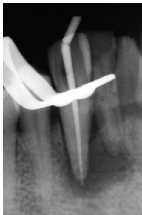
Obr. 3 Zavedený gutaperčový čep