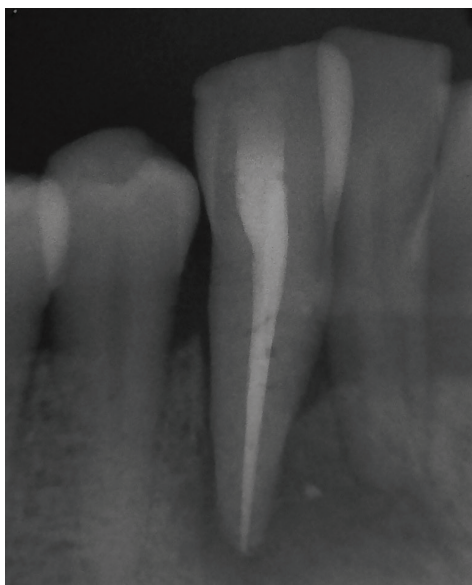
Obr. 4 Snímek po plnění

Kombinované léze mohou být klasifikovány do tří typů, jmenovitě: (i) zuby se dvěma oddělenými lézemi; jednou endodontickou (obvykle periapikální) a jednou parodontální, bez jejich komunikace; (ii) zuby s jednou spojitou lézí zahrnující endodontické a parodontální onemocnění; (iii) zuby s endodontickou a parodontální lézí, které byly dříve oddělené, ale později začaly komunikovat.