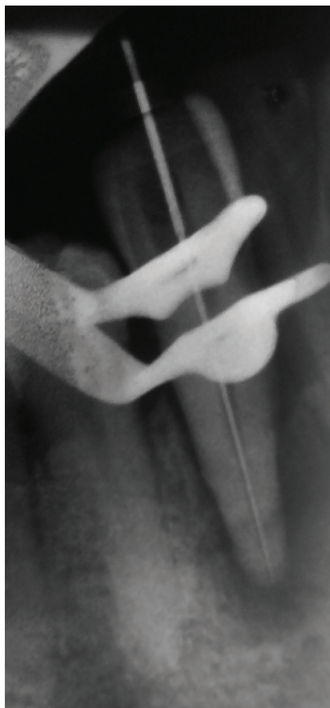
Obr. 2 Měřicí snímek