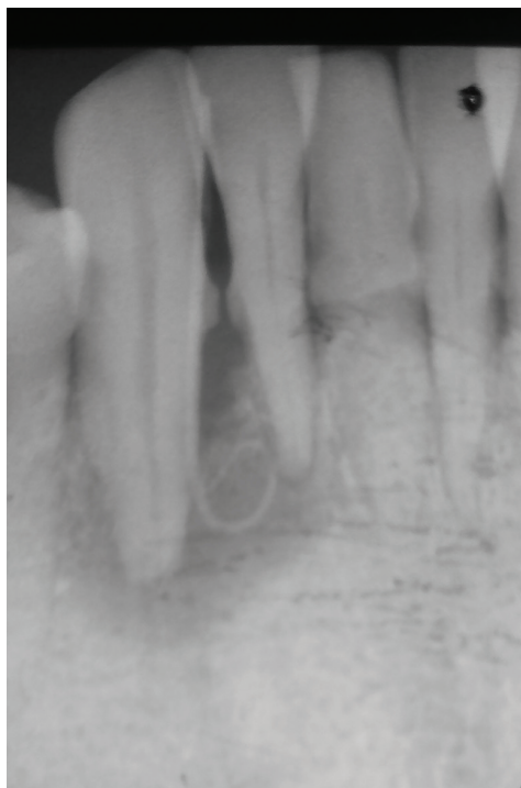
Obr. 1 Periapikální snímek zubu 43

Po dvou týdnech pacientka neudávala další bolest a cítila se mnohem lépe. Zub 43 byl znovu otevřen, hydroxid vápenatý byl odstraněn, kanálek vypláchnut 3% chlornanem sodným a 17% EDTA. Kanálek byl za-