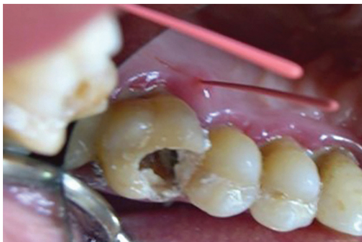
Fig. 6 Intra oral view on tooth 16