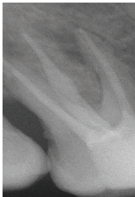
Obr. 8 Kontrolní snímek po šesti měsících