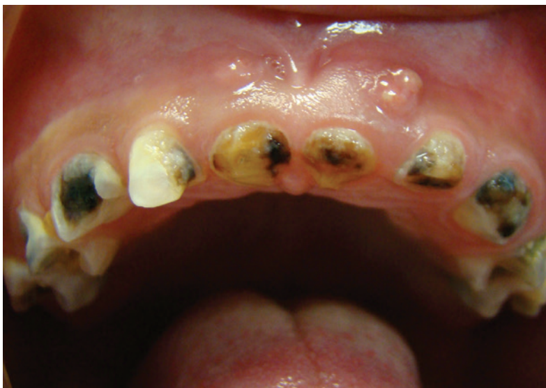
Fig. 2 The carious primary dentition of the 36-month-old child with inflammatory complication manifested as the parulis on the alveolar mucosa of upper jaw, left side

Obtíže se většinou objevují až tehdy, když je zánětem postižena celá korunková zubní dřeň [10, 11]. U frontálních zubů jsou obtíže přítomny často až v případě nekrózy zubní dřeně a následných zánětlivých komplikací [12].