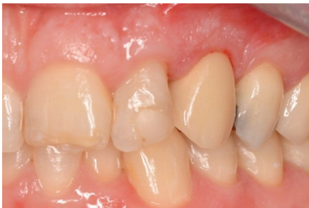
Obr. 4 Okluzní pohled na definitivní práci in situ

Pro tmelení suprastruktur na implantáty lze použít jak definitivní, tak provizorní fixační cementy. Volba provizorního fixačního cementu nabízí možnost snazšího sejmutí v případě nutnosti opravy protetické práce [10].