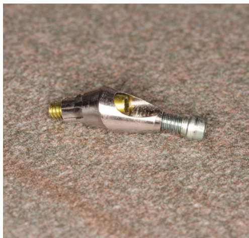
Obr. 2 Abutment pro tranzverzální šroubování

Na třetí návštěvu se pacient dostavil za půl roku. S barvou i tvarem korunky byl spokojen. Esteticky jej rušilo ústí manipulačního kanálu. Provizorní korunka byla sejmuta a její emergence profil byl mimo ústa otisknut do A-silikonu, konzistence putty. Z otisku byla vyjmuta provizorní korunka a byl do něj zaveden otiskovací pin. Diskrepance otiskovacího pinu a slizničního povrchu korunky byla vylita flow kompozitem a zpolymerována. Takto upravený otiskovací pin byl nasazen a utáhnut na implantát in loco 23. Po kontrole do sedu na rentgenogramu v limbální projekci byl otisknut metodou open tray. Zubní laboratoř pak zhotovila angulovaný abutment pro podmíněně snímatelnou práci ( obr. 2 ).