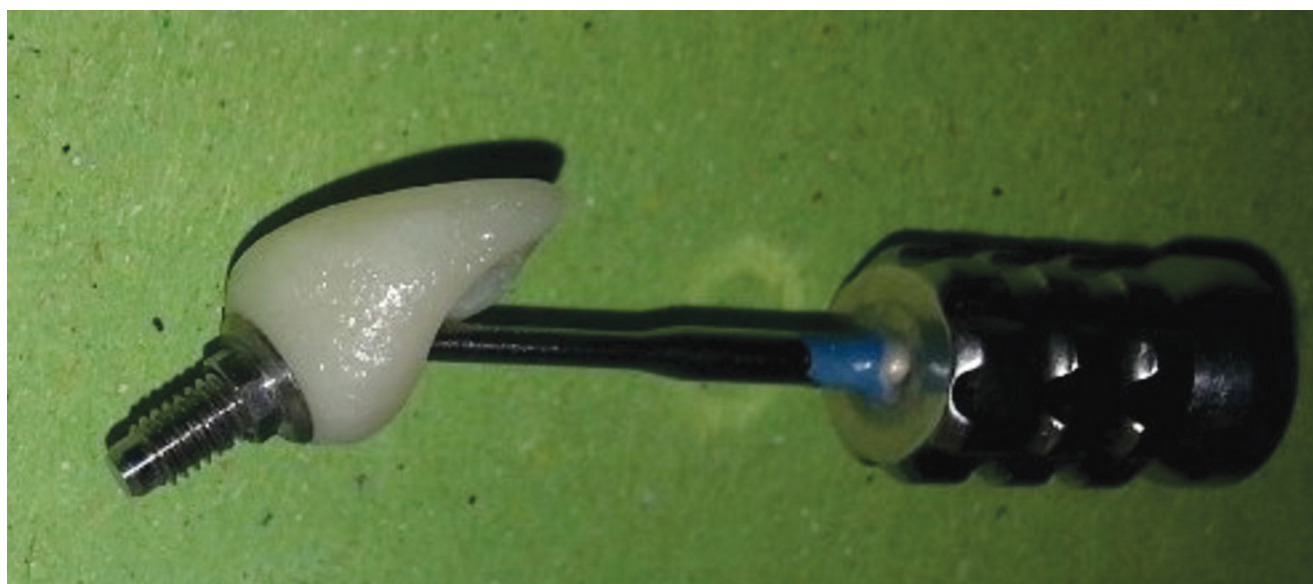
Fig. 5 The angulated screw