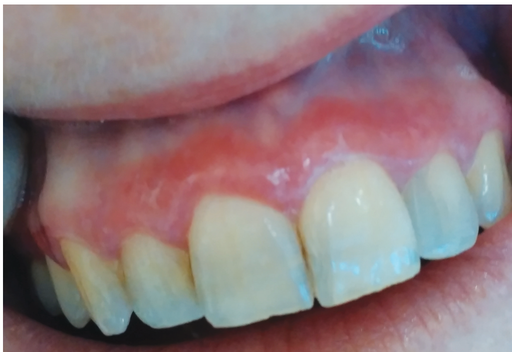
Obr. 1 Deskvamativní gingivitida v rámci orálního lichen planus

Existuje celá řada studií, které se věnují úloze stresu u pacientů s lichen planus a většinou se zaměřují na orální formu [27]. Psychosomatické faktory onemocnění a obecně jejich asociace s dermatózami je známa [28]. Chaudhary ve své práci se 43 pacienty potvrdil souvislost stresu, úzkosti a deprese s orálním