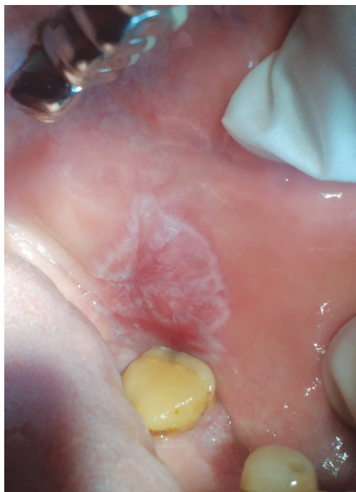
Obr. 4 Lichenoidní kontaktní léze