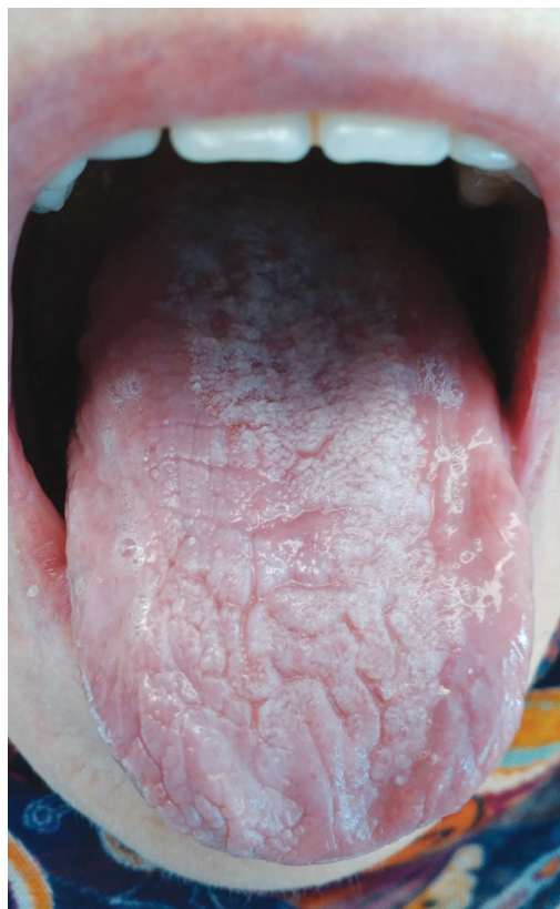
Obr. 2 Lichenoidní poléková reakce na alopurinol (z archivu autorky)