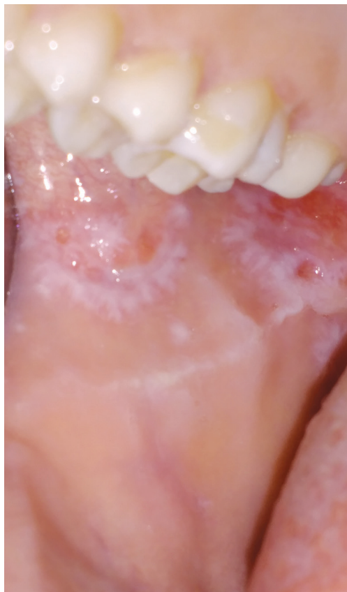
Obr. 6 Orální lichen planus, retikulární forma

Fitzpatrick a kol. zhodnotili 352 histopatologických vzorků dysplazie dlaždicobuněčného karcinomu ústní dutiny a u 29 % z nich prokázali lichenoidní změny [65].