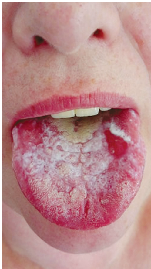
Obr. 3 Lichenoidní stomatitis, hypersenzitivita na kovové dentální materiály

Mnoho dentálních materiálů může v konečném důsledku vyvolat kontaktní alergii s rozličnými projevy, například symptom pálení orálních sliznic, stomatitis, cheilitidu či lichenoidní reakce lokalizované přímo v místě kontaktu s materiálem; u zdravotnického personálu mohou vyvolat kontaktní dermatitidu [70]. Objektivní změny zaznamatelné v praxi klinického lékaře tedy mohou zahrnovat celé spektrum projevů, např. stomatitis nebo cheilitidu, mnohdy s přítomností erozivních až ulcerativních tkáňových defektů [43]. Kovovými ionty indukovaná reakce přecitlivělosti může vyvolat změny srovnatelné se zánětem vyskytujícím se v rámci bakteriál-