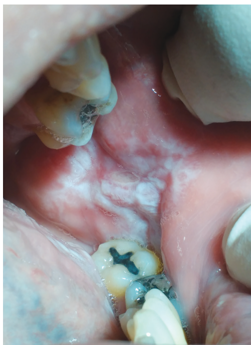
Obr. 5 Lichenoidní stomatitida, hypersenzitivita na kovové stomatologické materiály