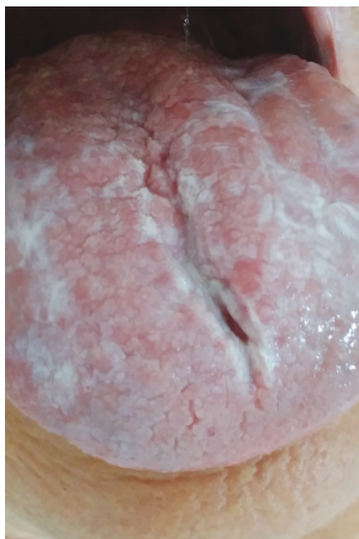
Obr. 7 Orální lichen planus, retikulární forma

Na etiopatogenezi orálního lichen planus se podílí celá řada odlišných faktorů. Navzdory novým poznatkům a přibývajícím studiím, které se tématu orálního lichen planus věnují, je jednoznačné určení vyvolávajícího činitele velmi obtížné, mnohdy až nemožné. V rámci diagnostického procesu je vhodné na základě zevrubné anamnézy určit suspektní faktory, které by mohly s největší pravděpodobností figurovat v etiopatogenezi orálního lichen planus nebo lichenoidní stomatitidy (léky, stres, hepatopatie atd.). Na základě důsledné multioborové spolupráce je možné diskutovat s ošetřujícími lékaři jiných odborností o možnosti například výměny určité medikace za jinou lékovou skupinu (typicky záměna betablokátorů) či po důkladném zhodnocení i možnost vysazení některého léku. V rámci prevence dekompenzace základního onemocnění, pro které byl původně lék nasazen, by měla být jakákoli manipulace s dávkováním a lékovou skupinou v rukou erudovaného specialisty (kardiologa, diabetologa, internisty a dalších). Samostatnou kapitolou je terapeutický management u lichenoidních lézí, které jsou s vysokou pravděpodobností vyvolané hypersenzitivitou na uvolňované