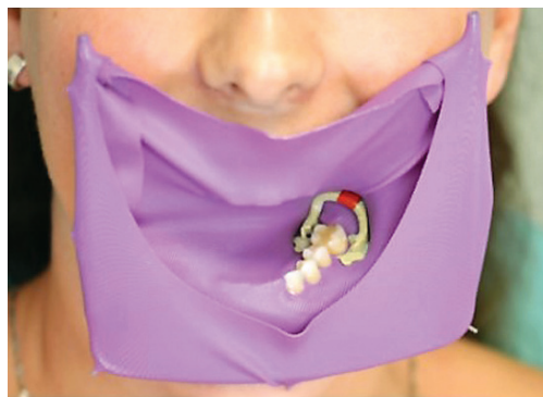
Obr. 1 Kofferdam aplikovaný do dutiny ústní

Další systémy zajišťující absolutní izolaci operačního pole jsou například OptiDam (Kerr Hawe SA, Švýcarsko) a OptraDam plus (Ivoclar Vivadent, Lichtenštejnsko). OptiDam využívá plastový rámeček modifikovaný podle tvaru obličeje pacienta ( obr. 2 ). OptraDam plus se skládá z gumové blány s vyznačenými mís-