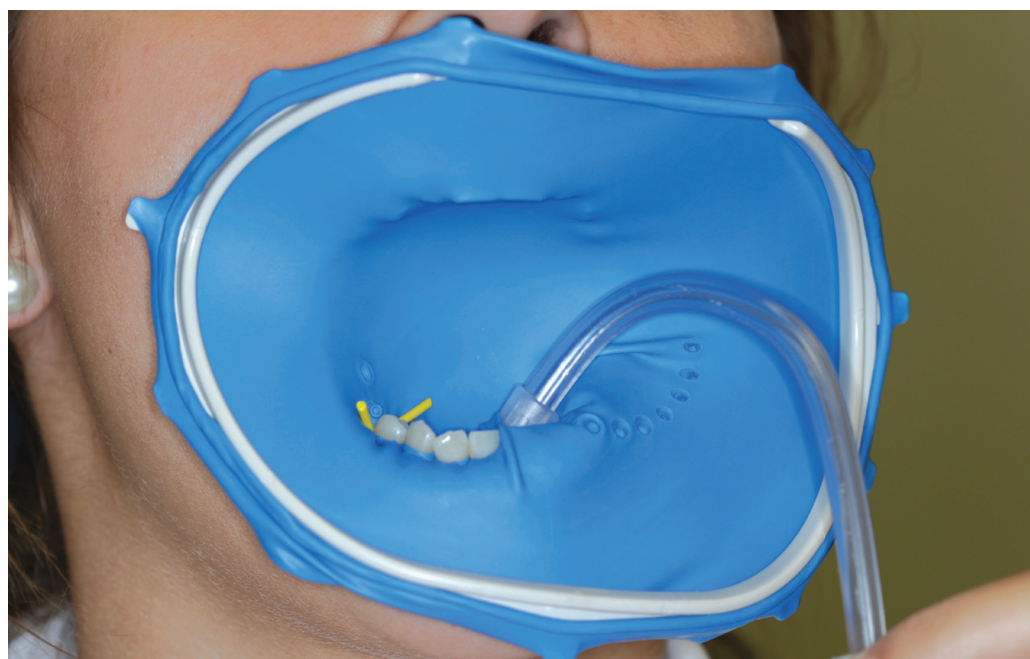
Obr. 2 OptiDam