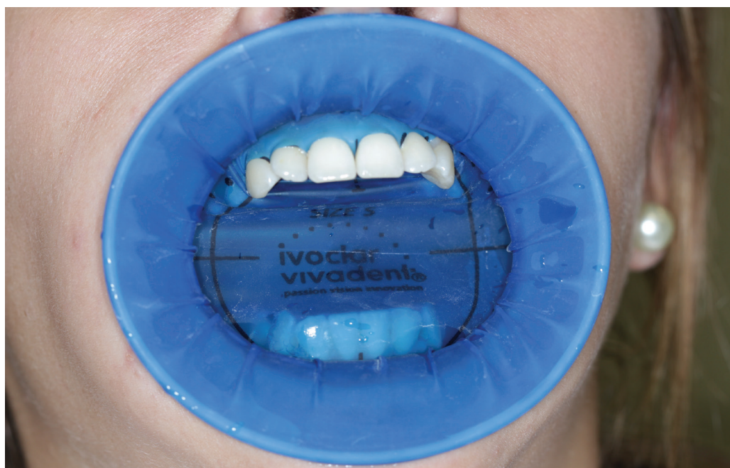
Obr. 3 OptraDam plus