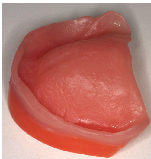
Fig. 2 Definitive basis with wax wall