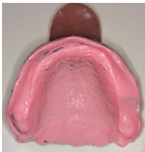
Obr. 2 Definitivní deska opatřená voskovým valem