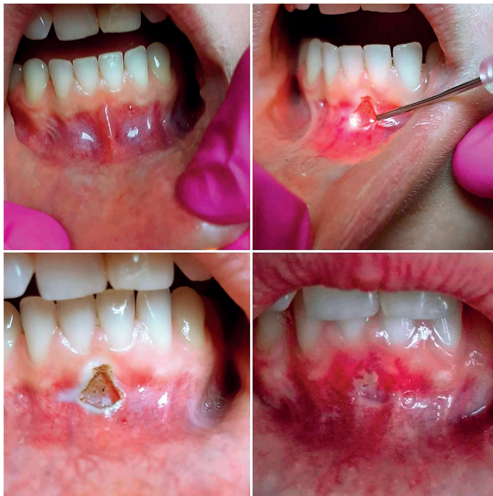
Obr. 3 Frenulektómia za použitia diodového lasera, stav pred frenulektómiou, adaptácia laserového lúča, rana bezprostredne po frenulektómii a rana týždeň po frenulektómii, modrá dióda 445nm

ČESKÁ STOMATOLOGIE ročník 118, 2018, 3, s. 73-80