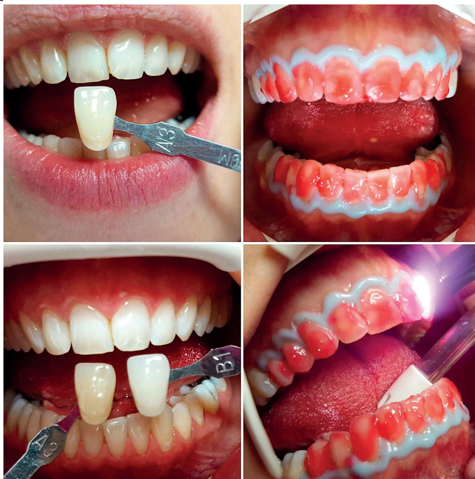
Obr. 2 Bielenie zubov laserom z A3,5 na B1, použitá multitip koncovka s bieliacim médiom

ČESKÁ STOMATOLOGIE ročník 118, 2018, 3, s. 73–80