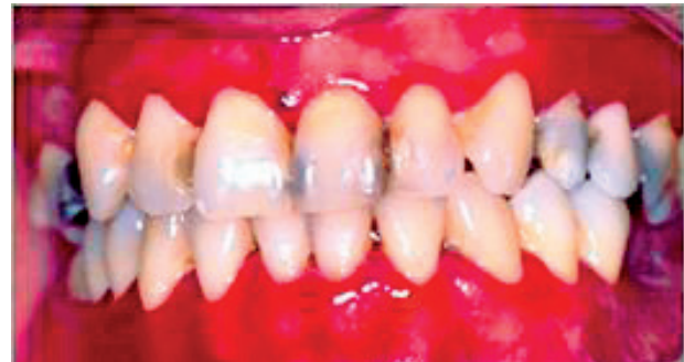
Obr. 6 Gingivitis desquamativa ako predchádzajúci stav vezikulárnej a erózívnej formy lichen planus (Ďurovič)

važovaný za prekancerózný stav a vyžaduje zvýšenú pozornosť v diferenciálnej diagnostike bielych plôch a v samotnom liečení.