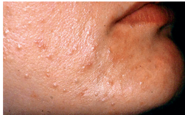
Obr. 2 Papulózne eflorescencie na koži tváre a retikulárna forma na korešpondujúcej tvárovej sliznici (Ďurovič)

Na sliznici sa lichenové papulky erupujú samostatne alebo v skupinkách. Sú porcelánovo bielej farby alebo farbu menia do šeda. Farba zápalu je tu krytá bielim hustým epitelom. Papulky zriedka môžu mať modro červenú farbu. Ich veľkosť je menšia ako na koži a na ich okolí zápalová reakcia chýba. Predilekčnou lokalizáciou sú bukálne sliznice, oklúzna línia molárov a sliznice jazyka. Niekedy sa však papulózne eflorescencie môžu objaviť aj na inom úseku slizníc. Často je postihovaná sliznica pier, boky jazyka, mäkké podnebie a sliznica v retromolárovej oblasti. Na povrchu tela jazyka sa často objavuje lichen anularis, ktorý môže imitovať lingua geographica.