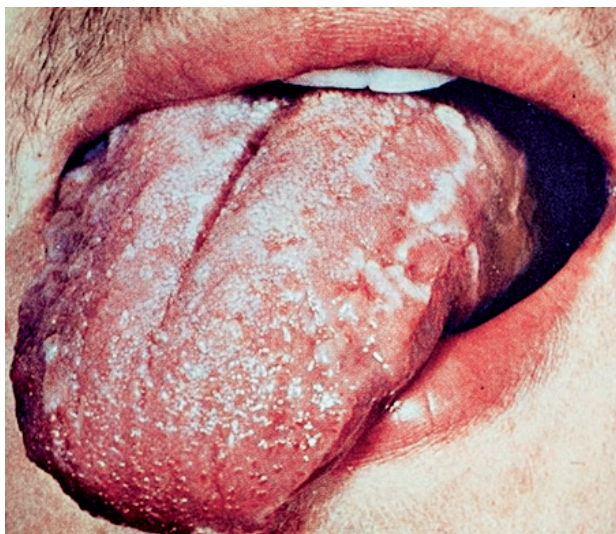
Obr. 7 Lingua geographica. Keratotické políčka sú prevažne na okrajoch jazyka. Pridružený je patologicky zmnožený povlak.

Lingua geographica sa značne dlhú dobu dávala do príčinnej súvislosti s horným dyspeptickým syndrómom a s tvorbou patologicky zmnoženého povlaku. Predpokladalo sa, že takto vzniknutý povlak je príčinou halitosis rôzneho stupňa. Niektoré nálezy sú značne kritizované, ale ostáva v platnosti názor, že poruchy procesu trávenia spolupôsobia na vyvolaní mapovitého jazyka.