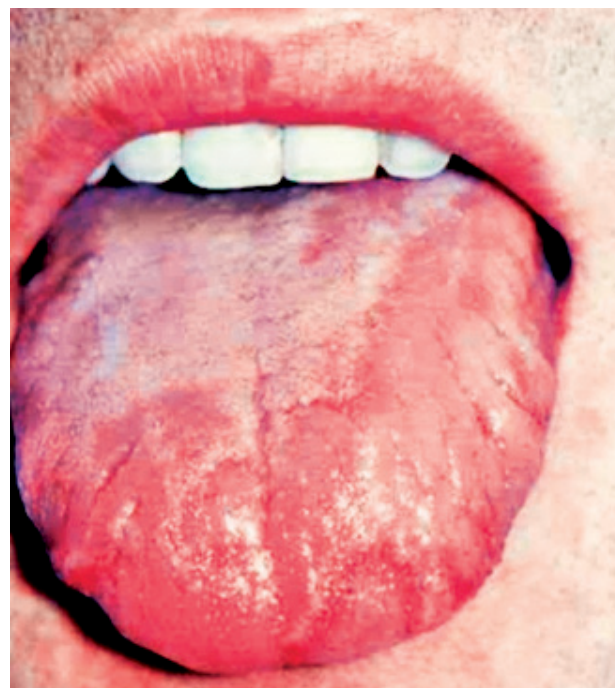
Obr. 6 Linqua geographica. Na tomto povrchu sa pridružuje patologicky zmožený povlak a prítomná je povrchová erózia na hrote jazyka.

Chorobný stav sa objavuje behom života v rôznych obdobiach a jeho klinický obraz sa neustále mení [9, 10]. Niekedy môže úplne vymiznúť. Prvotným a hlavným príznakom je atfia nitkovitých papíl. Histologický obraz obsahuje zápalové zmeny, ktoré odpovedajú subjektívnym ťažkostiam pacienta. Podľa toho nastupuje požiadavka na diferenciálnu diagnostiku, v ktorej je potrebné odlišiť GT od iných zápalových lézií. Dôležité je odlišiť tento stav od glositídy karenčného pôvodu.