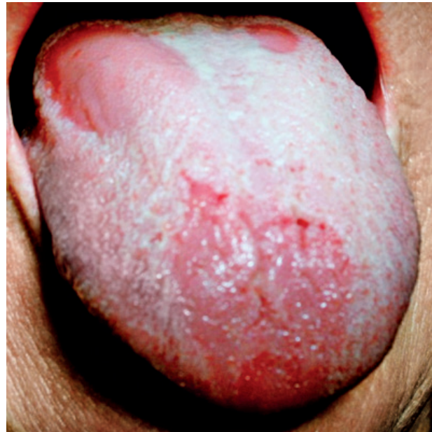
Obr. 8 Povlak jazyka patologicky zmnožený. Jeho olupovanie sa deje na väčších plochách na hrote a na tele jazyka. Stav imituje mapovitý jazyk.

PRAKTICKÉ ZUBNÍ LÉKAŘSTVÍ, ročník 65, 2017, 4, s. 49–54