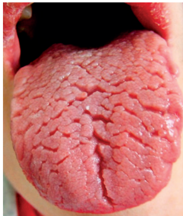
Obr. 2 Brázdy sú na celom tele jazyka a porušujú celistvosť aj smerom na hrany jazyka

Hlboké brázdy, ktoré vytvárajú laloky, sa stávajú aj rezervoárom tkanivového detritu a zvyškov potravy. V brázdach vznikajú druhotné povrchové zápaly, ktoré zvyšujú stupeň pálenia a pribúda aj slabá bolesť. Pri výskyte väčšieho počtu brázd môžeme na ich okrajoch pozorovať slabé červené farebné zmeny, ktoré svedčia pre regeneráciu filiformných papíl. Pri týchto stavoch sa môže vyskytnúť aj lingua geographica aj so svojou pridruženou symptomatológiou [4]. Pre objektívizovanie FT je vypracovaná metodika klinického vyšetrenia a hodnotenie stavu. Základ metodiky predstavuje sledovanie centrálnej brázdy na povrchu tela jazyka s nasledovnými kritériami: