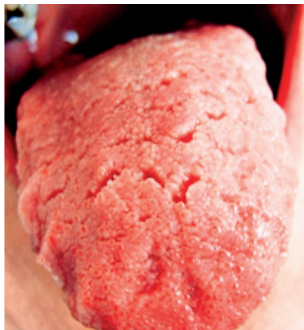
Obr. 4 Brázdy sú lokalizované na tele a hrote jazyka

V súčasnosti je známe, že sa často s inými zmenami na povrchu jazyka vyskytuje aj lingua fissurata.