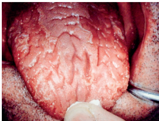
Obr. 1 Výskyt brázd na povrchu jazyka, imitujúce povrch mozgu (v starej terminológii lingua cerebriformis), bez prítomnosti povlaku jazyka

Praktické skúsenosti potvrdzujú, že povrchové nálezy nevyvolávajú žiadne ťažkosti. Odtiaľ pochádza stanovisko, že nález nie je potrebné liečiť. Skúsenosť však potvrdzuje, že vekom sa stav môže zhoršovať a pacienti si začínajú sťažovať na striedavé pálenie jazyka, ktoré je väčšinou vyvolané potravou alebo iným mechanickým podráždením [11]. Pocity pálenia krátko trvá a nedosahuje väčšiu intenzitu.