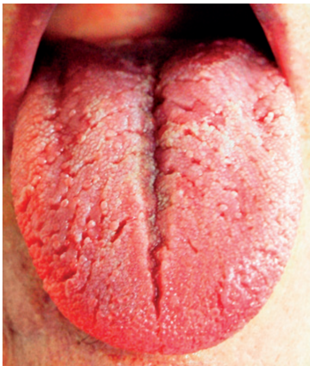
Obr. 3 Výrazný a hlboký sulcus medianus, od neho periférne k bokom sú rôzne hlboké brázdy v povrchu jazyka