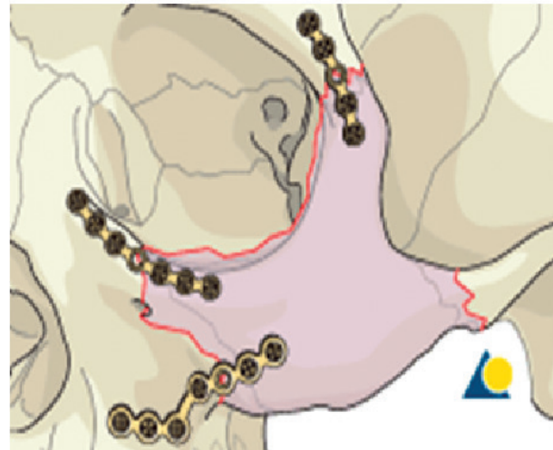
Obr. 2 Schéma osteosyntézy zlomeniny lícně-čelistního komplexu