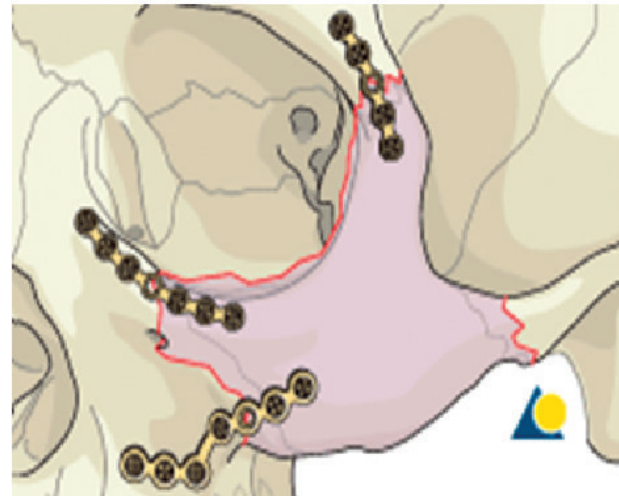
Obr. 2 Schéma osteosyntézy zlomeniny lícně-čelistního komplexu