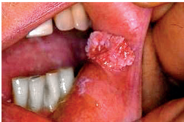
Obr. 10 Verukózná leukoplakia v ústnom kútku ( Đurovič)

Subjektívne ťažkosti sú prítomné pri škvrtnej lpl. a erytroplakii. Pacienti udávajú pálenie slizníc pri stravovaní a inom mechanickom dráždení. Fajčiarom nechutí cigareta a často pálenie prechádza do ostrej krátkej bolesti. Štípanie a pálenie je prítomné aj po kyslých jedlách.