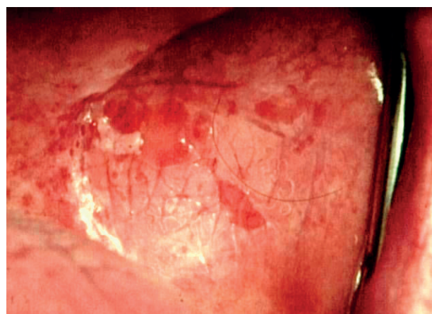
Obr. 4 Škvrnitá leukoplakia na ľavej bukálnej sliznici. Hyperkeratotické úseky sa v malých políčkach odlupujú a zanechávajú povrchové erózie červenej farby (Đurovič)

Ide o stav, kedy úseky hyperkeratoticky zmeneného tkaniva sú striedané eróziami alebo vredmi. Sem zaraďujeme aj stavy, kde sú ulcerácie medzi verrucami. Inou lokalizáciou fajčiarskych zmien môže byť dolná pera. Tu možno pozorovať stav preleukoplakie na sliznici, kombinovane s olupovaním sa pery. Tieto stavy môžu byť mierne zafarbené do žltá alebo žltá-hneda (obr. 4-6) [20].