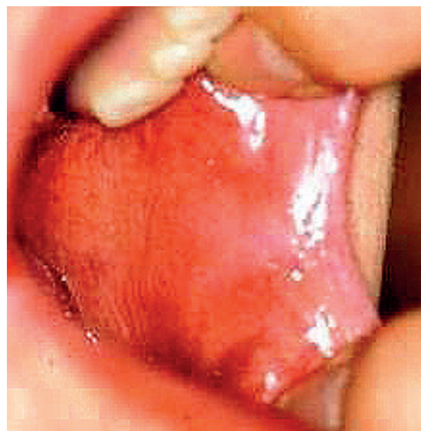
Obr. 1 Preleukoplakia bukálnej sliznice. Sliznica je jemne mliečne zakalená a belavá farba sa postupne stráca vo farbe normálnej sliznice (Ďurovič)

Predstavuje súrodý rohovejúci plát. Hyperkeratóza na sliznici nie je prerušovaná úsekmi zdravej slizni-