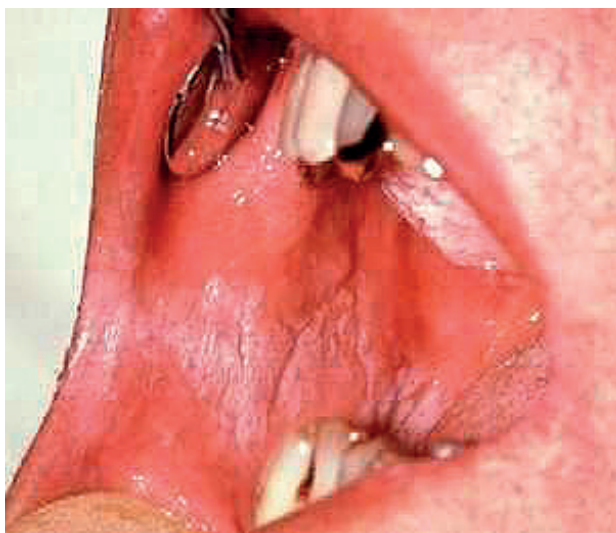
Obr. 9 Verukózná leukoplakia na bukálnej sliznici v okluzálnej línii (Đurovič)