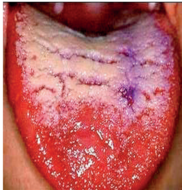
Obr. 7 Verukózna leukoplakia na povrchu jazyka. Rozsiahly leukoplakický plát je radiálne prerušený prasklinami, čím vznikajú veruky (Ďurovič)