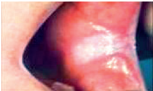
Obr. 2 Homogenná leukoplakia na ľavej bukálnej sliznici. Leukoplakický plát začína v ústnom kútiku, veľarovite sa rozširuje distálne a končí na hranici anteriórnej plochy bukálnej sliznice (Đurovič)