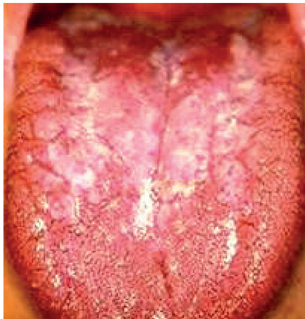
Obr. 6 Škvrnitá leukoplakia na povrchu jazyka. Olupovanie keratotických plátov je v oblasti koreňa jazyka. V prednej časti tela jazyka je homogenná hyperkeratóza (Ďurovič)

PRAKTICKÉ ZUBNÍ LÉKAŘSTVÍ, ročník 65, 2017, 2, s. 19–25