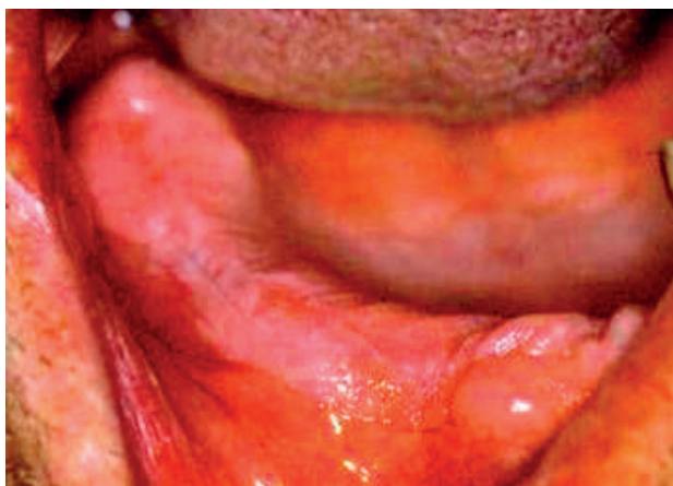
Obr. 3 Homogenná leukoplakia na pravom alveolárnom hrebenei v rozsahu od prvého premolára až po tretí molár. Ide o následok uvoľnenej fixnej náhrady a jej mechanického dráždenia (Đurovič)

давковým výrastkom hyperkeratoticky zmeneného tkaniva. Túto lpl. klinicky často označujeme termínom lpl. verucosa. Tieto útvary však v tomto type nemajú nadobudnúť takú veľkosť, že by dochádzalo v brázdach k tvorbe väčších priestorov alebo vredov.