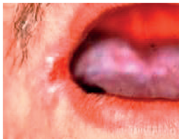
Obr. 8 Škvrnitá leukoplakia ústneho kútiku, prechádza do erytroplakie (Ďurovič)

Subjektívne ťažkosti pacientov sú značne individuálne a najviac závisia na klinickej forme leuko-