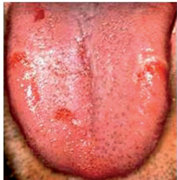
Obr. 5 Povlak je normálny, na povrchu jazyka sú čerstvé erozie. Stav je u recidívnej infekcii Helicobakter pylori (Ďurovič)

V posledných rokoch sme svedkami toho, že sa zvyšuje výskyt orálnych infekcií vyvolaných Candida albicans . Orálne kandidózy pozorujeme u pacientov v strednom veku s maximom výskytu u žien nad 40 rokov. Orálne kandidózy majú viac foriem, ale