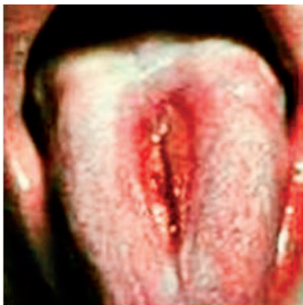
Obr. 7 Patologicky zmnožený povlak jazyka. Jeho olupovanie začína na koreni jazyka a pripomína mapovitý jazyk

najčastejšie sa vyskytuje vo forme glossitis rhombica mediana s lokalizáciou na koreni jazyka. V tomto mieste sa vyskytuje ružové pole, ktoré môže byť hladké alebo laločnaté, od ktorého smerom k apexu sa postupne odlupuje ľahký povlak bohatý na kultúry kandid. Smerom distálnym ostáva miesto bez povlaku, ktoré kontinuálne mierne páli. Pocity