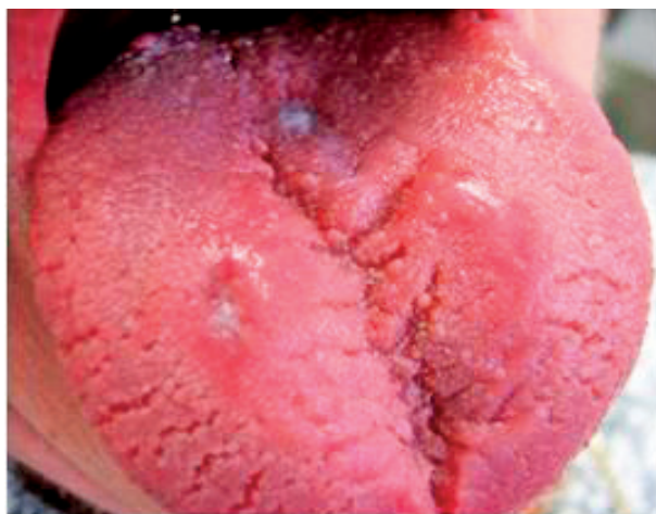
Obr. 2 Linqua plicata. Rýhovanie je lokalizované do tela jazyka a jeho pravého okraja. Na pravej polovine začína atrofická lichenifikácia (Vodrážka)