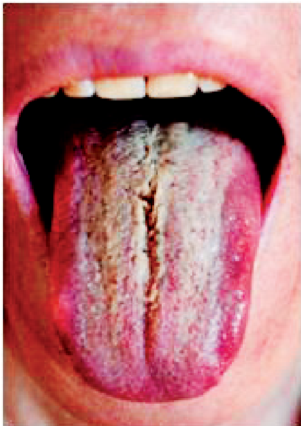
Obr. 1 Prechod patologicko-zmnoženého povlaku do žltých nakošenin filiformných papíl, z ktorých v strednej ryhe tela jazyka sa diferencuje linqua vilosa žltej farby (Timková)

Jednou z najčastejších lézií je prehĺbenie alebo nedokonalé vyvinutie sulcus medianus. Keď dochádza ku jeho prehĺbeniu, jeho vnútorné okraje sú hladké bez prítomnosti filiformných papíl a v týchto miestach ich prirodzená výmena viazne. Do tejto fissúry sa zachytáva tkaninový detritus a mikroorganizmy. Najčastejšie pozorujeme rozmnoženie sa Candida albicans , tvorí sa jeho silná vrstva a často dá základy ku tvorbe bielo žltému povlaku nerovnakej hrúbky.