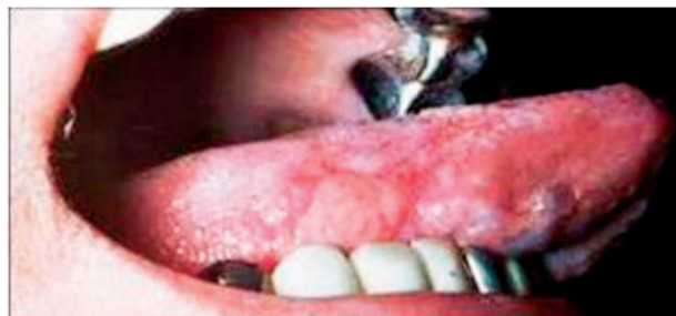
Obr. 8 Glositis areata migrans. Prítomný je patologicky zmnožený povlak s erozívnymi políčkami. Stav je pri infekcii Helikobakter pylori

Poslednú dobu častým výskytom je prejav erythema exsudativum multiforme a to tej formy, ktorá sa izolovane vyskytuje na častiach jazyka (obr. 8). Je to rozsiahla lézia izolovane na boku jazyka, má belasú alebo žltú farbu, dá sa odlúpnúť s miernym povrchovým krvácaním alebo bez neho a ostáva sliznica živo červenej farby. Z ťažkostí dominuje silné pálenie, podobne ako pri aphthosis major. Ak sa vyskytne bolestivosť, táto je silná a obvyčajne provokovaná mechanickým, prípadne chemickým podráždením.