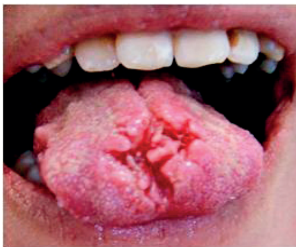
Obr. 3 Linqua plicata. Hlboké trhliny sú prítomné na hrote a trla jazyka. V týchto miestach často vznikajú druhotné povrchové zápal (Vodrážka)

PRAKTICKÉ ZUBNÍ LÉKAŘSTVÍ, ročník 65, 2017, 2, s. 26–30