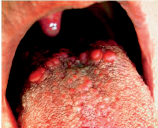
Obr. 9 Hyperplasticky a zápalovo zmenené papilae circumvallatae. Zápal postihuje aj chuťové poháriky a časť filiformných papíl. Stav je u ezofageálnom refluxe (Tímková)

PRAKTICKÉ ZUBNÍ LÉKAŘSTVÍ, ročník 65, 2017, 2, s. 26–30