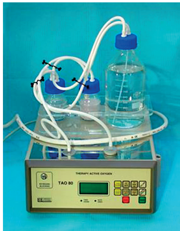
Obr. 1 Ozonizátor TAO 80 pro přípravu ozónované vody

Po vstupním vyšetření a stanovení diagnózy ošetřující lékař vyplnil formulář „Záznam vyšetření a ošetření“. Při diagnóze alveolitis sicca byla extrakční rána pomocí stříkačky naplněna ozónovanou vodou v množství, které vyplnilo zubní lůžko, nechala se působit jednu minutu a poté se odsála sterilním tamponem. Následně byl do extrakční