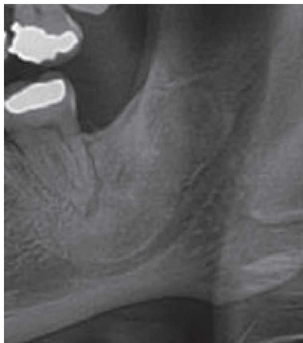
Obr. 2 Ortopantomogram zhotovený před extirpací folikulární cysty (a) a za rok po jejím odstranění (b)

PRAKTICKÉ ZUBNÍ LÉKAŘSTVÍ, ročník 64, 2016, 2, s. 25-32