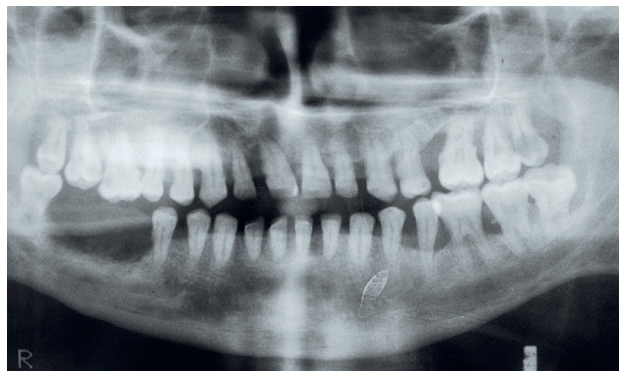
Obr. 3a OPG snímek muže ve věku 36 let, který byl od dvou let věku léčen pro diabetes mellitus 1. typu, diabetickou retinopatií a nefropatií. Generalizovaná pokročilá parodontitis s nepravidelnou resorpcí alveolární kosti a ztráta dvou pravých dolních molárů pro viklavost. Muž zemřel ve věku 39 let na diabetickou nefropatií.