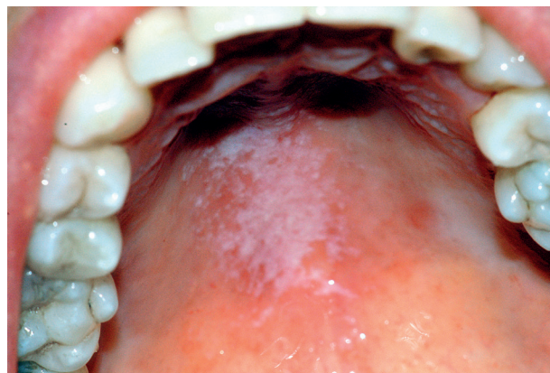
Obr. 1 Akutní pseudomembranózní kandidóza na patrové sliznici po léčbě antibiotiky u pacientky s diabetem 2. typu

Nedostatečná tvorba slin , hyposalivace (potvrzená scintigraficky) [18] a z ní vyplývající xerostomie, byla zjištěna u 10–30 % diabetiků [30], někteří autoři uvádějí pocit suchosti úst až u 50–60 % případů [20, 37]. Se sníženým množstvím slin souvisí i atrofie ústní sliznice (zejména atrofická glossitis) a snazší tvorba dekubitů pod snímacími zubními náhradami. Příčina hyposalivace není zcela jasná, ale pravděpodobně se na ní podílejí polyurie, narušení bazálních membrán žlázového epitelu a poruchy mikrocirkulace [27]. Nedostatek slin může vést společně se sníženou imunitou a vyšší hladinou glukózy ve slinách k manifestaci orální kandidózy [11, 27]. Projevuje se především jako chronická atrofická kandidóza na patře u pacientů se snímacími zubními náhradami, angulární cheilitida nebo pseudomembranózní kandidóza (obr. 1). U dekompenzovaných diabetiků reaguje nedostatečně na lokální antimykotickou léčbu. Tito diabetici jsou také náchylnější k bakteriálním zánětům způsobeným odontogenní infekcí a k jejich rychlému šíření [27]. Další komplikací je porucha hojení měkkých tkání a opožděné hojení extrakčních ran [27, 30, 40]. Nepříjemné jsou stomatodynnické a glosodynnické obtíže , u kterých se