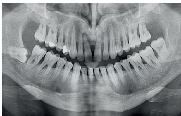
Obr. 3b OPG snímek 42letého muže s nedostatečně kompenzovaným diabetem 1. typu s velmi dobrou hygienou dutiny ústní. Generalizovaná parodontitis s rozsáhlou resorpcí alveolární kosti, s vertikálními kostními defekty a postižením furkací.