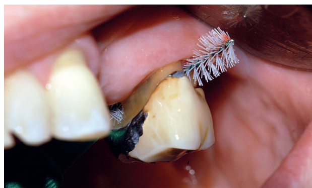
Obr. 4 Žena ve věku 56 let s dobře kompenzovaným diabetem 2. typu a pokročilou parodontitidou. Po parodontologické léčbě je stav stabilizovaný. Pacientka udržuje výbornou ústní hygienu včetně použití mezizubních kartáčků v oblasti furkace.

zánětem na takové množství mikrobiálního povlaku, které by pro celkově zdravého jedince bylo z hlediska vyvolání gingivitidy ještě podprahové [6]. Některé práce uvádějí, že již u dětí s diabetem 1. typu (věk vyšetřovaných 6–18 let) byly zjištěny známky parodontitidy, a to dvakrát až třikrát častěji ve srovnání se zdravými dětmi [21, 25]. Lalla se spolupracovníky zjistila, že rychlejší progresse parodontitidy u diabetických dětí má přímou souvislost s vyšší hladinou glykovaného hemoglobinu v krvi, a tedy s horší kompenzací onemocnění [21]. Autoři z těchto výsledků vyvozují, že parodontitida může být jednou z prvních komplikací diabetu u dětí. Také u dospělých diabetiků 1. typu koreluje postižení parodontu se závažností a kvalitou kompenzace základního onemocnění a s přítomností dalších diabetických komplikací (obr. 3 a, b).