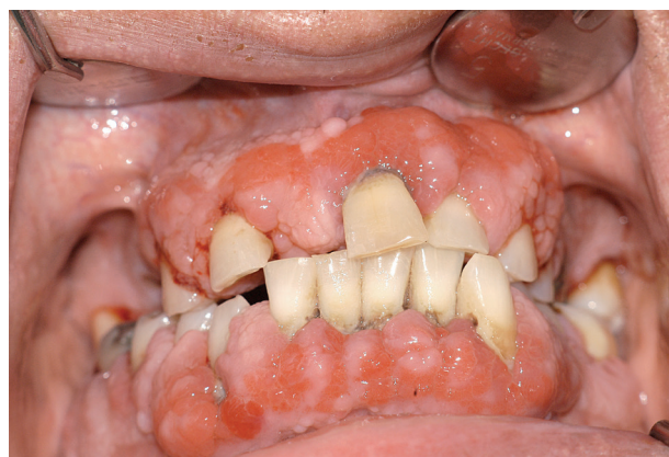
Obr. 5a, b, c Generalizovaná parodontitis a poléková (léčba blokátory kalciových kanálů) hyperplastická gingivitis u pacientů s diabetem 2. typu. Nedostatečná ústní hygiena zesiluje vliv této medikace. Převažuje exsudativní složka zánětu a tvorba granulační tkáně.

Strukturální a funkční změny na kapilárách parodontálních tkání jsou podobné těm, které se popisují na oční sítnici a glomerulech ledvin diabetiků [29]. Vlivem AGEs jsou bazální membrány kapilár zesílené a obsahují depozita polysacharidů a drobné hemoragie [26]. Tyto změny redukuje krevní průtok, zvyšují viskozitu krve a také snižují možnost migrace leukocytů a imunitních faktorů do gingivální