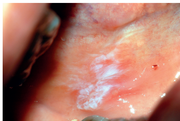
Obr. 2a, b, c Výskyt orálního lichen planus současně s onemocněním diabetes mellitus a arteriální hypertenzí je označován jako Grinspanův syndrom. Retikulární léze na bukových sliznicích u tří pacientek s diabetem 2. typu a léčenou hypertenzí.

zvýšuje incidenci, prevalenci, progresi a závažnost parodontitidy [24, 31, 33, 48].