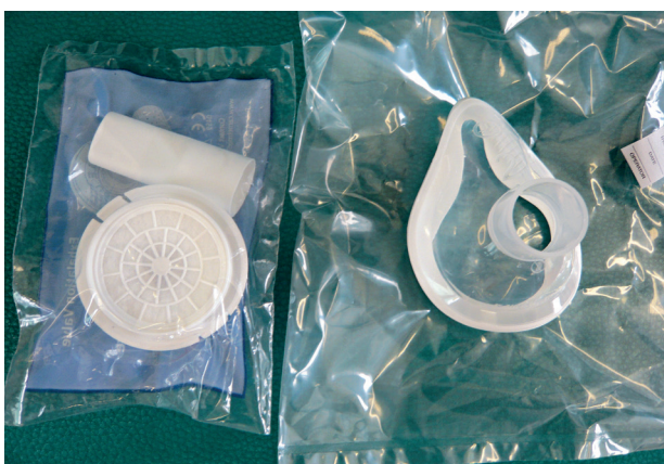
Obr. 3 Filtr, náustek a obličejová maska

pro zavěšení např. na lůžko a rychlospojka pro připojení nádechového ventilu. Pro inhalační aplikaci se používá jednosměrný nádechový ventil, který se otvírá pouze při nádechu pacienta, a tím minimalizuje spotřebu plynu. Nádechový ventil umožňuje použít náustek (pro dýchání ústy) nebo inhalační obličejovou masku (pro dýchání nosem i ústy), je-li to pro pacienta výhodnější nebo pohodlnější. Při použití nádechového ventilu pacient drží ventil s filtrem a náustkem v ruce a inhaluje ústy. Náustek i obličejová maska jsou jednorázové pro každého pacienta [13]. Ve stomatologii je možné použít i nosní masku, která se připojuje na výstup kontinuálního průtoku na horní ploše tlakové láhve.