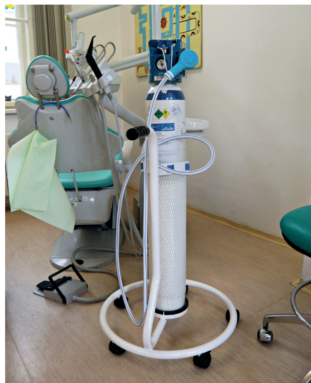
Obr. 1 Směs se dodává v odlehčené hliníkové tlakové lahvi

ČESKÁ STOMATOLOGIE ročník 114, 2014, 3, s. 60–66