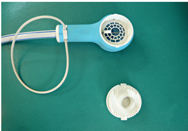
Obr. 2 Nádechový ventil Carnet

ČESKÁ STOMATOLOGIE ročník 114, 2014, 3, s. 60-66