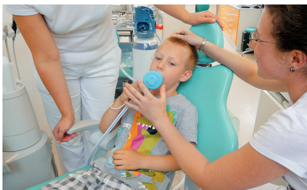
Obr. 5-8 Příprava před sedací směsí oxidu dusného

Negativní vjemy, jako je hlasitý hovor nebo hluk při přípravě instrumentária, mohou vzhledem k probíhající hyperakuzii průběh inhalační sedace narušit. V průběhu ošetření neprojevujeme netrpělivost, nespěcháme, protože pacient je ve vulnerabilním stavu a citlivě vnímá přítomný spěch nebo nezájem lékařského týmu a reaguje strachem nebo neklidem. Odpovídající řeč těla a eventuální fyzický kontakt dotykem ruky před dalším slovním pokynem podporuje pozitivní průběh vyšetření. Pacient má být během ošetření klidný, psychicky uvolněný, oslovitelný a schopný spolupráce se zdravotnickým personálem. Pacientovi vysvětlíme postup a získáme si v ideálním případě jeho aktivní spolupráci.