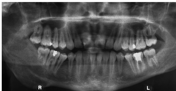
Obr. 2 OPG šest měsíců po ukončení terapie

Šest měsíců od poslední aplikace ukázalo kontrolní OPG a CT výraznou regresí nálezu a novotvorbu kostí. Vzhledem ke vzácnosti této nemoci neexistují rozsáhlejší soubory pacientů k vyhodnocení účinnosti konzervativní léčby. Ve studii Nogueira a kol. se pouze u dvou z 21 pacientů léčených intralezionální aplikací triamcinolonu ukázala negativní odpověď [12]. U pacientů s neúplnou odpovědí, kde nedošlo zcela k vymizení projasnění na RTG, prokázalo histologické vyšetření enukleovaného, zbytkového nálezu pouze vazivovou tkáň bez charakteru CGCG [12]. Intralezionální aplikace kortikosteroidů byla s úspěchem použita i u recidiv chirurgicky léčených lézí [1].