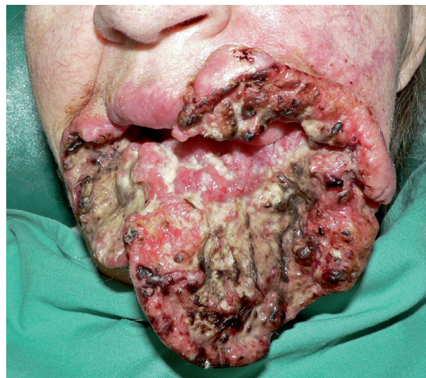
Obr. 5 Spinaliom dolního rtu: rozsah T4