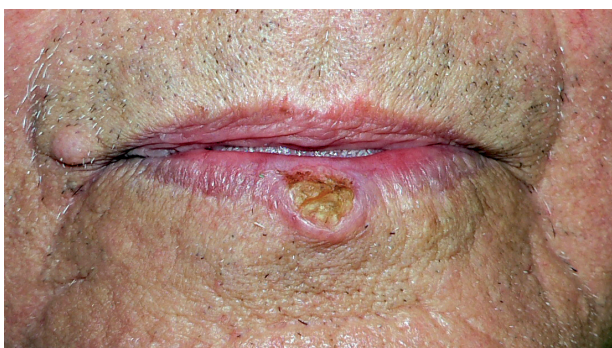
Obr. 2 Spinaliom dolního rtu: rozsah T1