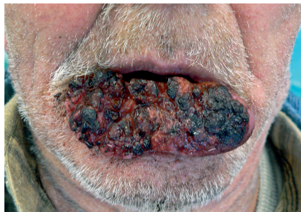
Obr. 4 Spinaliom dolního rtu: rozsah T3