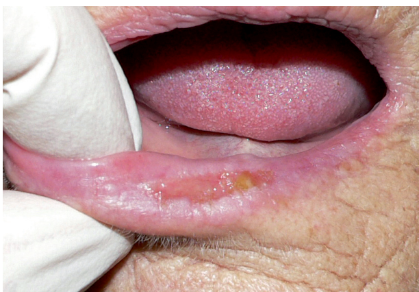
Obr. 1 Spinaliom dolního rtu: rozsah Tis na podkladě abrazivní cheilitidy

Pomocí klinických informačních systémů PC DENT (CompuGroup Medical, Česká republika s.r.o., verze 3.1.1, revize:6) a WinMedicalc (Medicalc software s.r.o., Česká republika, verze 2.8.13.41, DD 502) byli vyhledáni pacienti s diagnózou dlaždicobuněčného karcinomu rtu, kteří se léčili v průběhu sedmi let (leden 2002 - prosinec 2008) na Stomatologické klinice LF UK a FN v Plzni. Bylo identifikováno 72 pacientů se 73 dlaždicobuněčnými karcinomy