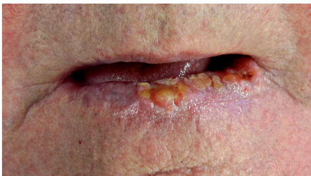
Obr. 3 Spinaliom dolního rtu: rozsah T2