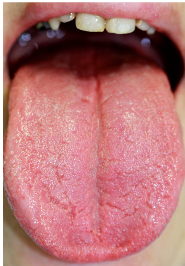
Obr. 5 a, b, c Obrácený skus (a), anomální konfigurace tvrdého patra a alveolárních výběžků horní čelisti (b), makroglosie s přidruženou mírnou arborizací (c) u ženy trpící akromegalii zjištěnou při vyšetření provedeném primárně pro hemato-onkologické onemocnění