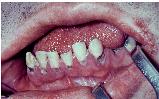
Obr. 6 a, b Postižení stálé dentice s tvorbou tremat a diastemat při akromegalii v obou zubních obloucích (a), pacient též na obr. 4, a v dolním zubním oblouku (b), pacient též na obr. 1 a 3