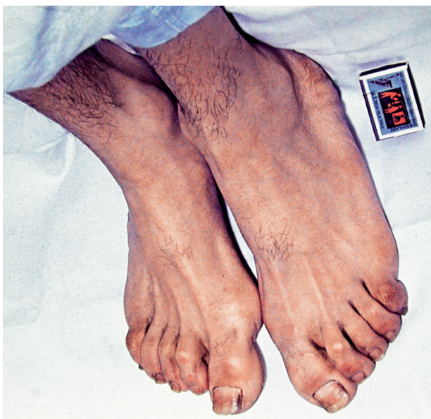
Obr. 1 a, b Vzhled rukou (a) a nohou (b) pacienta s akromegalii, pacient též na obr. 3 a 6b