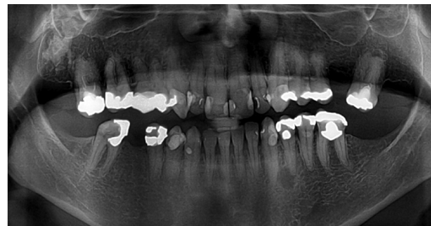
Obr. 2 Ortopantomogram pacientky z obr. 5 s nálezem atypicky mohutné mandibuly při akromegalii. Kost jeví normální strukturu, stálý chrup je nekompletní