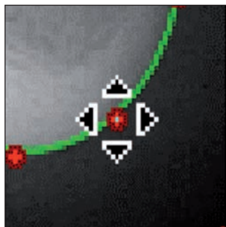
Obr. 2 Ukázka přesnosti zadávání kefalometrických bodů v programu Dolphin Imaging

Kefalometrické snímky byly zkalibrované a proměřeny v ortodontickém počítačovém programu Dolphin Imaging 11.0 (obr. 1). K měření byla použita McLaughlinova kefalometrická analýza, protože popisuje vzájemnou polohu horní a dolní čelisti ve vztahu k okluzní rovině. Lze tak zjistit, zda konfigurace maxilomandibulárního komplexu je funkčně ideální (obr. 3). Pomocí přesného zadávání kranio-metrických bodů (tab. 1) byly počítačem vypočteny kefalometrické hodnoty (tab. 2). Program Dolphin Imaging umožňuje během zadávání kranio-metrických bodů zvětšovat studované kontury skeletu lebky na rentgenogramu a pomocí kurzoru se středním vycentrováním je přesnost určení konkrétního bodu nesrovnatelně přesnější než při zadávání ručním na nedigitalizovaném snímku (obr. 2). Kefalogramy byly pořizeny v přirozeném postavení hlavy, se zuby v maximální interkuspidaci a s uvolněnými rty. Přirozená poloha hlavy (NHP – natural head posture) znamená, že pacient by při snímkování měl stát nebo sedět, dívat se na sebe do zrcadla a hledět sám sobě do očí. Snímky jsou pořizovány v maximální interkuspidaci, aby bylo možné určit Angleovu třídu, protože se jedná o standardní vzájemné postavení obou čelistí, ve kterém se měří kefalometrické úhly. Relaxované rty jsou důležité pro posouzení estetiky obličeje a velikosti interlabiální mezery.