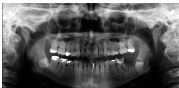
Obr. 2 Ortopantomogram s projasněním kolem korunky retinovaného zubu 38, prázdným lůžkem po zubu 37 a kazem destruovaným zubem 36

a cysty výkon proto pokračoval repozicí kostních úlomků a jejich fixací rigidní osteosyntézou (obr. 3). Bezprostředně po operaci pacientka udávala parestézii levé poloviny dolního rtu a brady, a docházela proto na pravidelné klinické kontroly a aplikaci vitamínu B 12 . Porucha čítí s ústupem pooperačního otoku zcela vymizela. Histologicky se jednalo o nízce buněčnou vazivovou tkáň s četnými mikrokalciifikacemi a s fokálním zánětlivým infiltrátem; jen ojediněle se na povrchu částice nacházel krátký úsek pravidelného dlaždicobuněčného epitelu. Materiál pocházel ze stěny sekundárně změněné folikulární cysty.