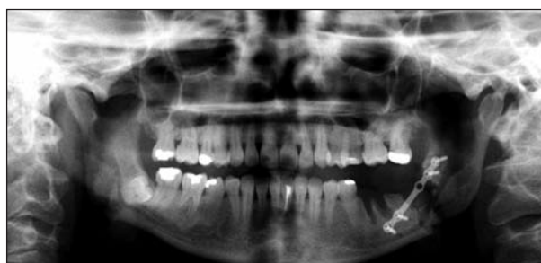
Obr. 3 Ortopantomogram – stav po vybavení zubů 36 a 38, repozici a osteosyntéze iatrogenní zlomeniny těla dolní čelisti