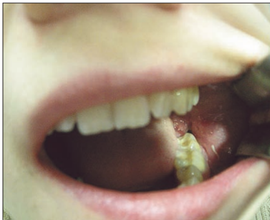
Obr. 1 Poextrakční zánět zubního lůžka po extrakci zubu 38, třetí den po chirurgické extrakci