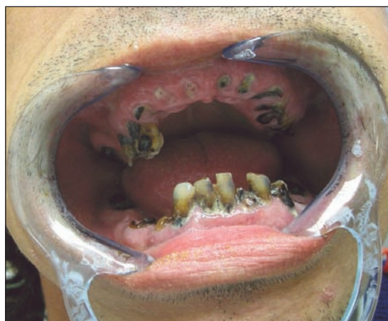
Obr. 5 Malhygiena jako významný rizikový faktor vzniku alveolitis