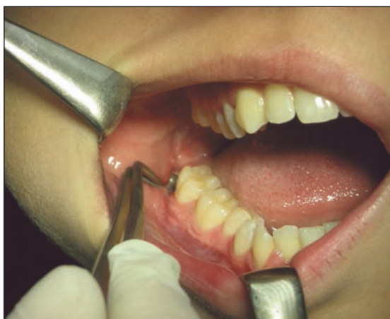
Obr. 2 Prázdné zubní lůžko po extrakci zubu 48