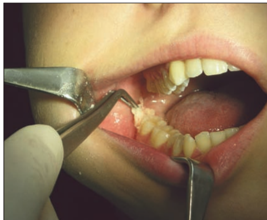
Obr. 4 Aplikace tamponády s Framykoinem a Benzokainem do zubního lůžka 48